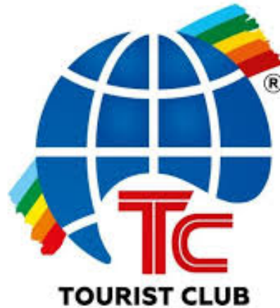
Рис. 2.3 Логотип туроператора «Tourist club»

На даний момент «Tourist club» - визнаний лідер туристичної галузі в сфері персоналізованих подорожей. Компанія акредитована Міжнародною Асоціацією Повітряного Транспорту (IATA), яка має право продавати авіаквитки більш ніж 300 авіакомпаніям в Україні та за кордоном, а також надавати різні маршрути, які найбільше підходять для компанії.