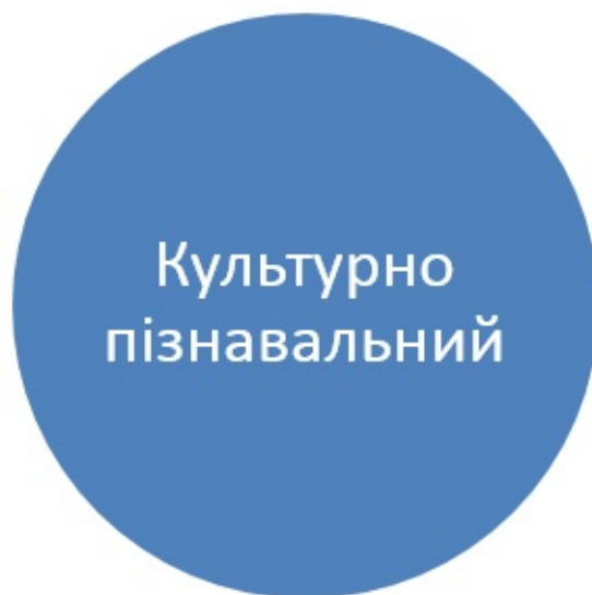
Рис.5. Види туризму