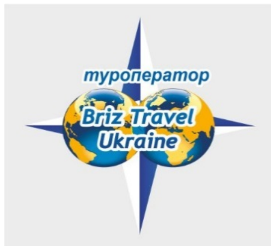
Рис. 2.2 Логотип туроператора "Бриз Тревел Україна"

Компанія "Бриз Тревел Україна" розташована в самому центрі Дніпропетровська, вулиця Московська, 10.