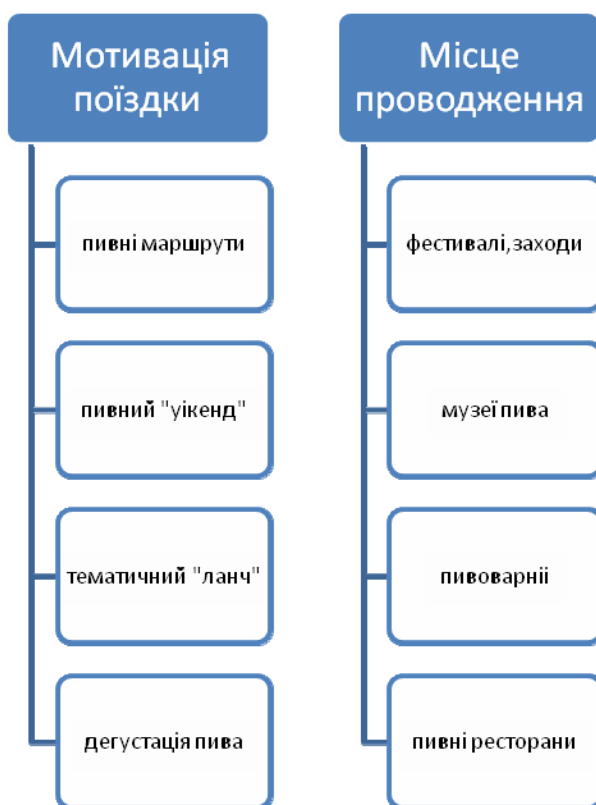
Рис.1.2 Система пивного туризму

Пивці та інші туристи часто цікавляться відвідування пивоварних заводів та місць і заходів, пов'язаних з пивом. Таким чином, пивний туризм є з галуззю, що набирає популярність, оскільки з кожним роком все більше туристичних агенцій пропонують тури в регіони пивоваріння.