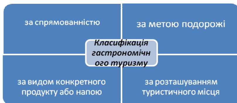
Рис.1.1 Класифікація гастрономічного туризму

Для кращого розуміння та сприйняття гастрономічного туризму, умовно його поділяють на ряд класифікацій.