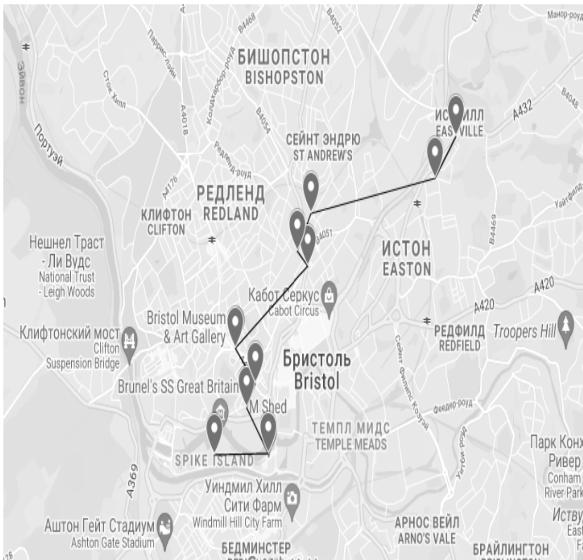
Рисунок 2.1 Карта маршруту

Отже, інформація подається динамічно для того щоб, глядачу було цікаво. Також поділена на 3 частини інформаційну, основну та завершувальну.