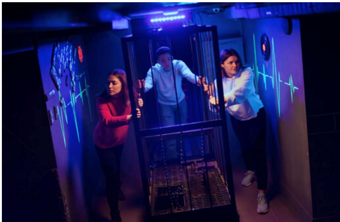
Рисунок А 1.1. Фото экшн-квесту.