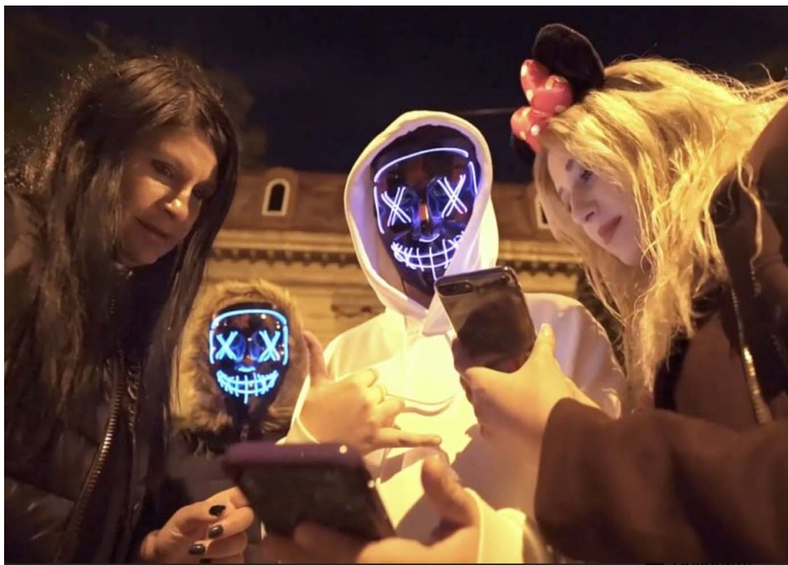
Рисунок А 2.1. Квест-екскурсія по Свані в Хеллоуїн