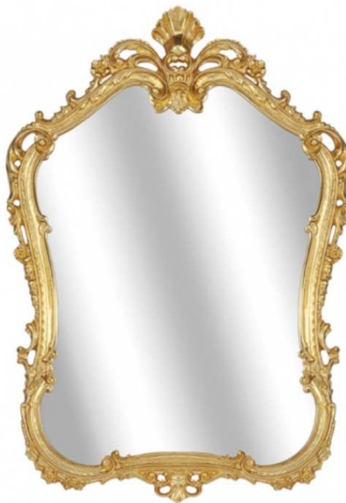
Рисунок Б. 3 Дзеркало