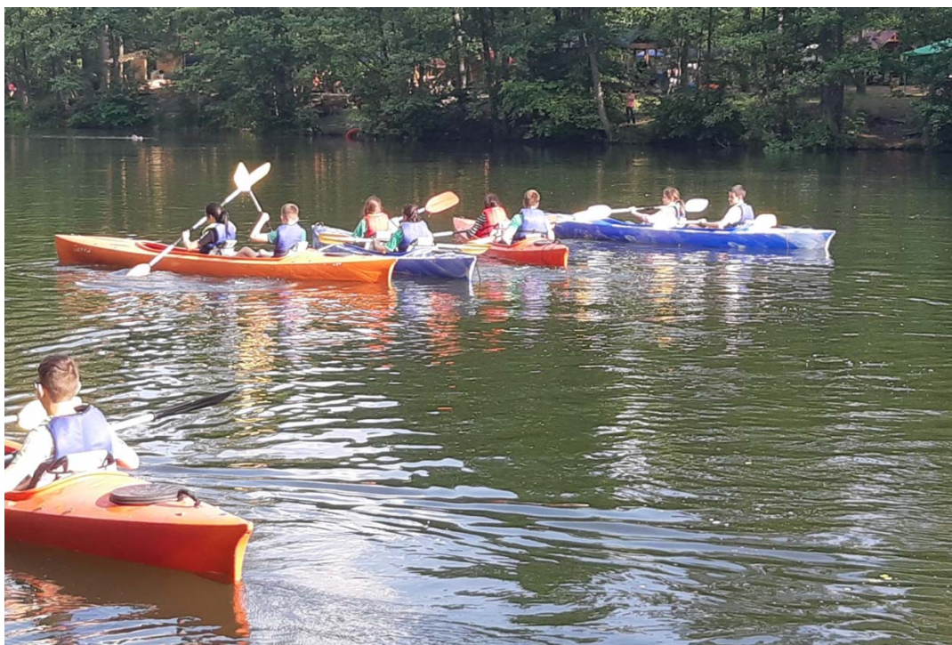
Рисунок А 2.4 Проходження квесту в МДЦ «Артек» Пуща-Водиця