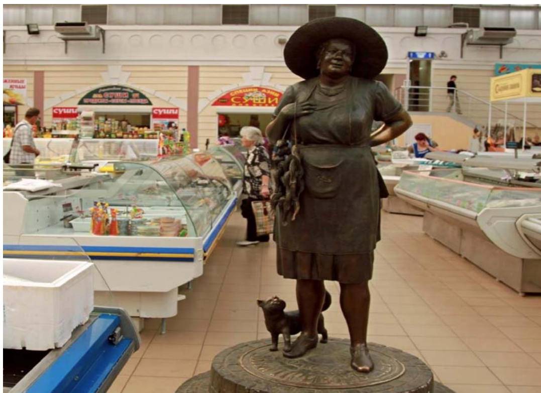
Рисунок А 2.2 Пам'ятник рибачки тьоті Соні