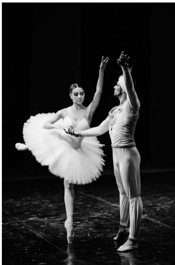
Рисунок Б. 2 Фото балерини на сцені

Відповідь : Харківський Національний Академічний Театр Опери та Балету