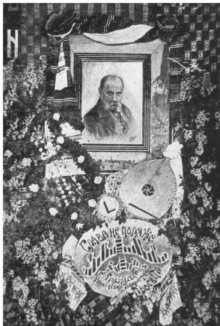
Мал. 1. Портрет Т. Шевченка роботи М. Дяченка в Подільській «Просвіті». Папір, друк. Кам'янець-Подільський, «Дністер», 1911

Навесні 1911 р. 6 живописних робіт молодого художника на українську тематику (серед них, «Катерина»), 162 малюнки з писанок, 29 скомпонованих з писанкового орнаменту узорів вишивок експонувалися в Кам'янець-