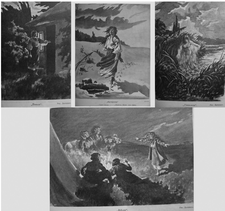
Мал. 5. Ілюстрації М. Дяченка до творів Т. Шевченка. Папір, друк. Журнал «Женское дело». Москва, 1911

трий би зримими образами передав мислі Шевченка ще не було, і досі нема нікого, хто б потрапив живописати душу поета». «Ілюстратори не змогли ще проіннятися духом Шевченка й в ілюстраціях своїх нічого не змогли дати іншого, окрім тих же гарних убрань на дієвих особах і біленьких хаток, затінених «Каламовськими» деревами, які до речі сказати малював і сам Шевченко» [14, с. 2]. Але, звичайно, інакше і бути не могло, адже поступ ілюстративної шевченкіани на той час тільки починався, а молоді митці намагалися слідувати заданим самим поетом-художником канонам.