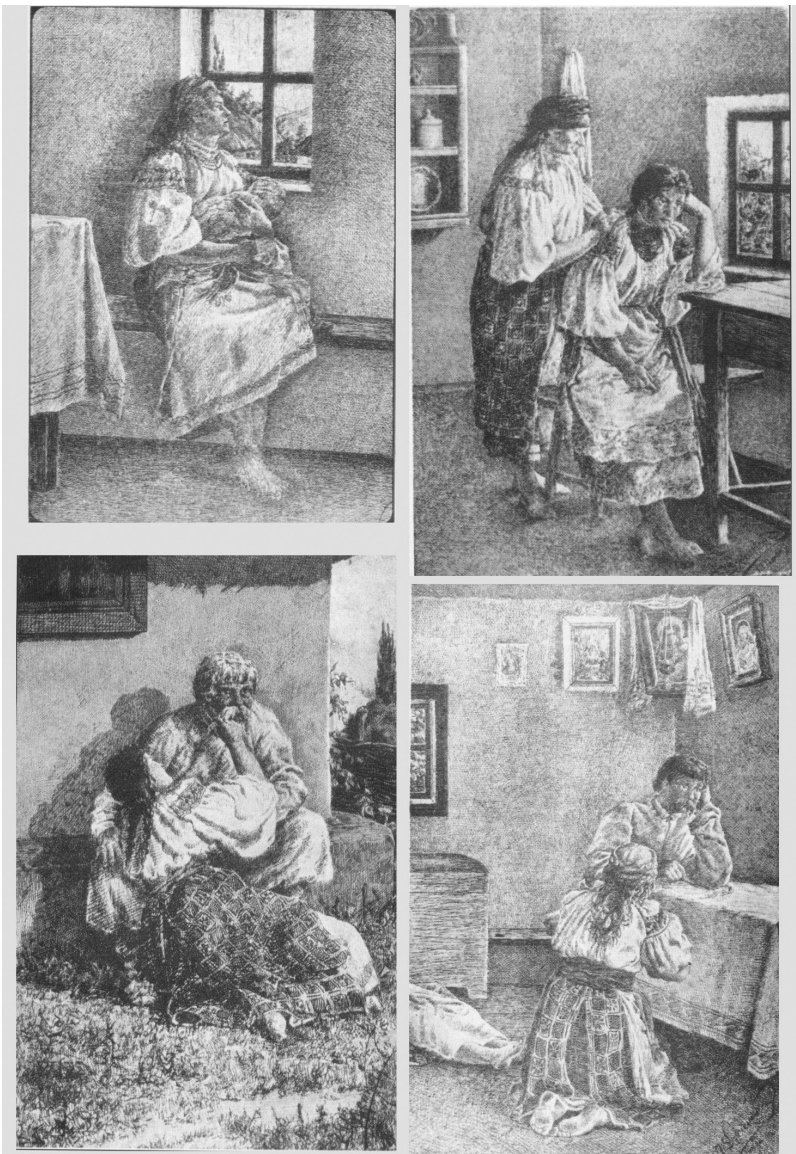
Мал. 2. Листівки з ілюстраціями М. Дяченка до творів Т. Шевченка. Папір, друк. Кам'янець-Подільський, 1911