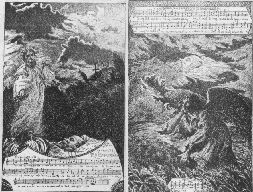
Мал. 3. Листівки з ілюстраціями М. Дяченка до «Дум на смерть Шевченка». Папір, друк. Кам'янець-Подільський, 1911

Подільському на виставці робіт місцевих художників. Дописувач київської газети «Рада», що підписався як А. Б. (цей криптонім використовував Андрій Ілліч Жук, котрий на той час мешкав у Львові і був активним дописувачем «Ради») всі роботи Дяченка охарактеризував як «надзвичайно цікаві, як з етнографічного так і з художнього боку», хоча «чогось особливого трудно було б сподіватися, взявши на увагу одірваність Кам'янця од культурних центрів, а також і те, що трохи не всі експоненти» малювали «лиш «в вільні од служби часи» [1, с. 3]. Майже одразу після цього б графічних творів – 4 ілюстрації до поезій Тараса Шевченка («Катерина поглядає – нема та нема...», «Катерина: прости мені, мій братику», «Сотник: то вусами страшеними», «Тополя: «Іди, доню!» – каже мати...») (мал. 2) та 2 – до «Дум на смерть Шевченка» («Ніч, як ворон», «Літа, квилить...») (мал. 3) – було видано листівками у Кам'янець-Подільських видавництвах «Дністер» і