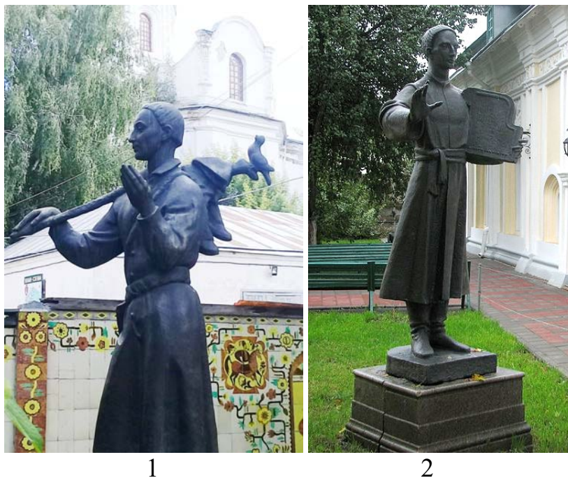
Рис. 5. Пам'ятники Г. С. Сковороді в м. Переяслав-Хмельницький. 1 – 1986 р. авторства В. П. Луцака; 2 – 1989 р. авторства П. В. Романюка.

В. П. Луцак) (рис. 5:1). Зображуючи босоногого філософа з клунком за плечима, скульптор передав ефект невагомості й зависання у повітрі як символ байдужості до матеріального буденного світу. Через три роки (1989 р.) на Воскресенській площі Переяслав-Хмельницького з'явився другий монумент роботи молодого скульптора П. В. Романюка (зараз знаходиться на подвір'ї музею Г. С. Сковороди). У своїй дипломній роботі автор зобразив мислителя і гуманіста у статичній позі з музичним інструментом (цитрою) у руці (рис. 5:2). Таким чином підкреслювався не лише літературний а й музично-поетичний талант філософа, яким він активно ділився з учнями під час викладання у Переяславському колеґіумі.