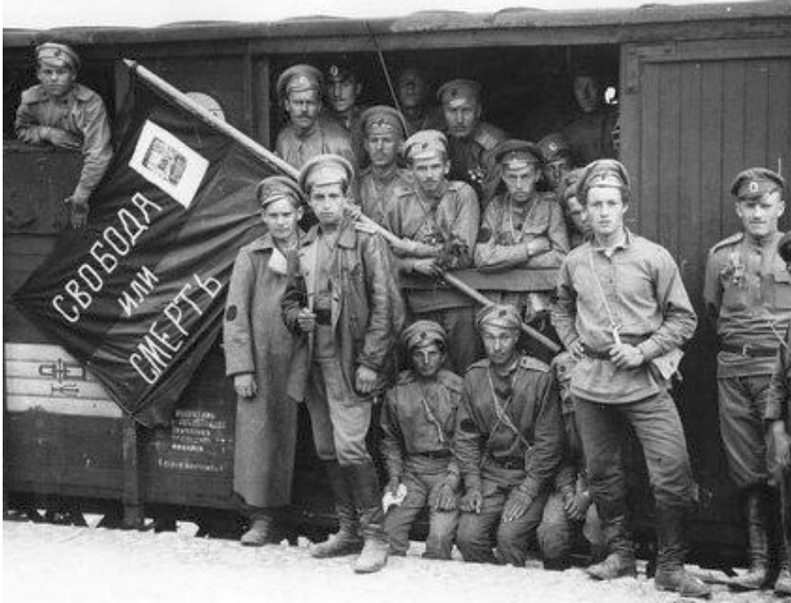
Загін Михайла Муравьова (крайній праворуч). 1918 р.

быть немедленно расформированы, их имущество передать в военнореволюционный комитет гор. Киева». 23