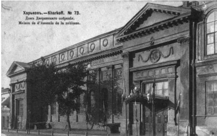
Будинок дворянського зібрання. г. Харьков, Миколаївська пл.