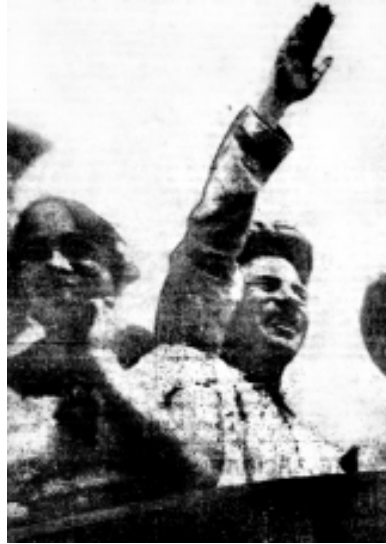
Павло Постишев на першотравневій трибуні. В 1934 році таке вітання рукою ще не вважалося нацистським.

Услід за урядом та політбюро в новій столиці почали концентруватися й «мізки нації» – наукова і творча інтелігенція. Хто з нехиттю, хто з примусу, а хто і з великим задоволенням. Газета «Комуніст» від 23 червня 1934 року в статті «Недалеке завтра» непрямо підтвердила мусовані тоді в Харкові балачки: «А що буде далі, коли це буде не столиця, а обласне місто? Чи й далі так міцно, так повнокровно буятиме тут життя? Чи не втратить місто того чудового вигляду, до якого вже звикли «харківчани» (так в оригіналі – Л.М.) і який зараз вражає чужинців, що в один голос визнали Харків за одне з найпрекрасніших міст у Європі?».