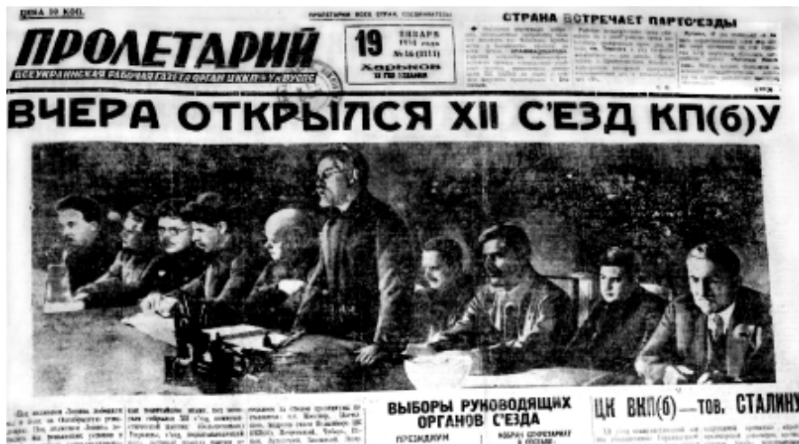
Перша шпальта головної газети ще столичного «Пролетарія» 19.01.1934 р.

і не отримує хлібного і продовольчого пайка. Зараз на будові 1097 осіб – робітників без хліба, хліб купується за комерційною ціною, на це немає ні коштів, ні дозволу. Звернення до Наркомпостачу СРСР і до Облнаркомтяжпрому не дало ніяких позитивних результатів. Просимо посприяти в отриманні хліба для вказаної кількості робітників». 64