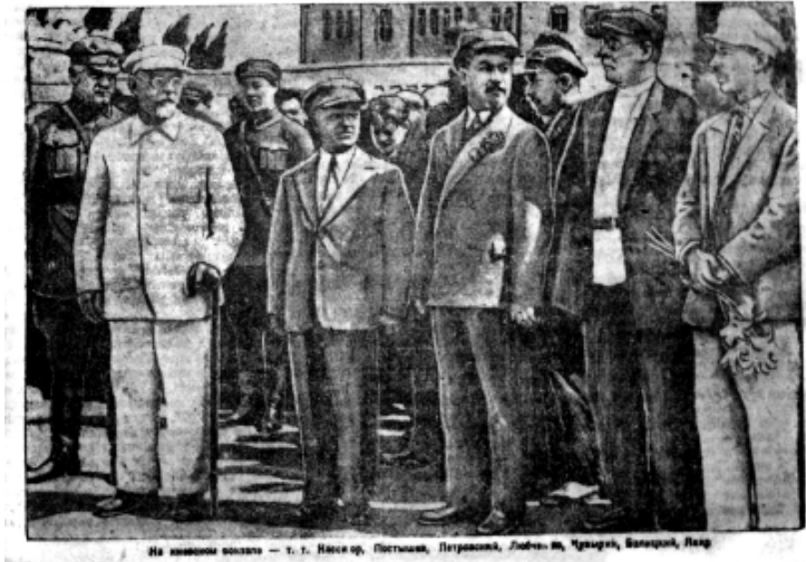
Керівництво країни на Київському вокзалі. 24 липня 1934 року.