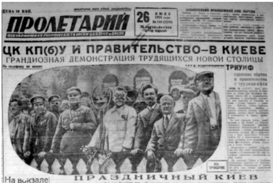
Керівництво країни приймає парад перед корпусом Опері 24 липня 1934 року.