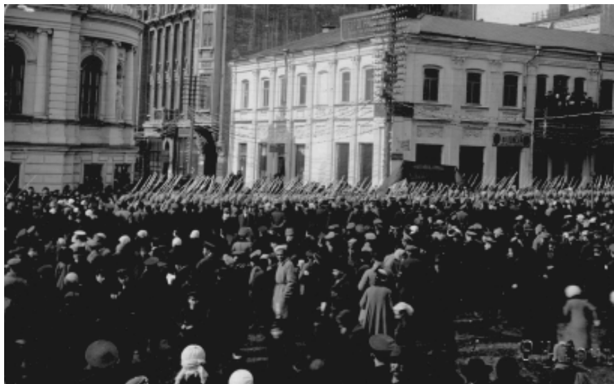
Мітинг по вул. Сумській. м. Харків. Березень 1917 р.

До початку зими 1916-17 року кількість прибулих біженців перевищила всі мислимі межі. Вони зайняли всі нічліжки, готелі, заїжджі двори і придатні приміщення. Умови проживання були жахливі, побутових зручностей, цілком зрозуміло, в основному, не малося. Той, хто знаходив роботу, старався знайти пристойне житло. Але Харків і за мирного часу не мав надлишків житлової площі. У 1916-1917 роках, не дивлячись на страждання людей, ціни на оренду житла зросли ще вище.