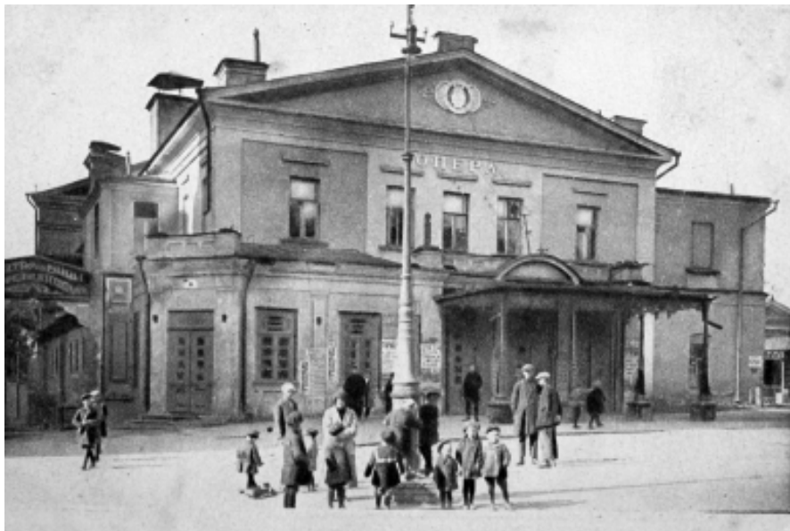
Приміщення Опер, де відбувся останній у Харкові з'їзд КП(б)У

Перемоги Харківської області – перемоги більшовиків Харківщини на чолі з кращим соратником тов. Сталіна – П.П. Постишевим». Окозамилювання несусвітнє: Сталін не міг не знати справжнього стану справ, а народу не було що «показувати» – він на своїй шкірі відчув отой «стан справ». То для кого ж призначався цей спектакль? Скоріше за все – для себе. Більшовикам хотілося переконати самих себе, що у них все гаразд. Такою була «технологія» комуністичного будівництва.