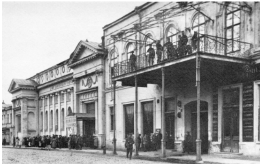
Німецька командатура в будинку Дворянського зібрання. г. Харьков. 1918

РРФСР, німцям довелося піти на поступку російському уряду і «здавати» Україну. В. Ленін дав вказівку вступати в переговори з умовою: жоден німецький солдат не може повернутися до Німеччини озброєним. Такою хитрістю українські більшовики обзаводилися зброєю для війни з ... українцями.