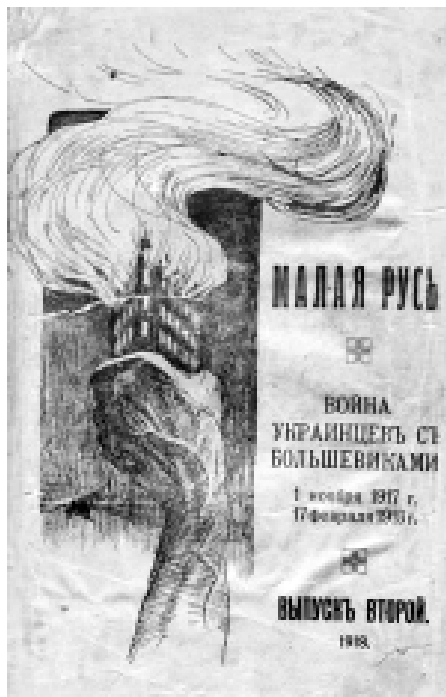
Обкладинка журналу "Мала Русь" з малюнком факела - палаючого будинку Грушевського

рукописи й матеріали, бібліотека і переписка, колекції українських старинностей, що зберав я стільки літ, збірки килимів, вишивок, зброї, посуду, порцеляни, фаянсу, окрас, меблів, малюнків. Довго було б оповідати, і прикро навіть згадувати. Ніякі сили вже тепер не вернуть його... [...] Україна також поховала своє старе в сім огнищі, в сій руїні, в могилах своїх дітей, забитих рукою большевиків, як я в могилі матери, яку півживою винесли з пожару і вона за кілька день умерла від сих страшних заворушень і потрясень». 25