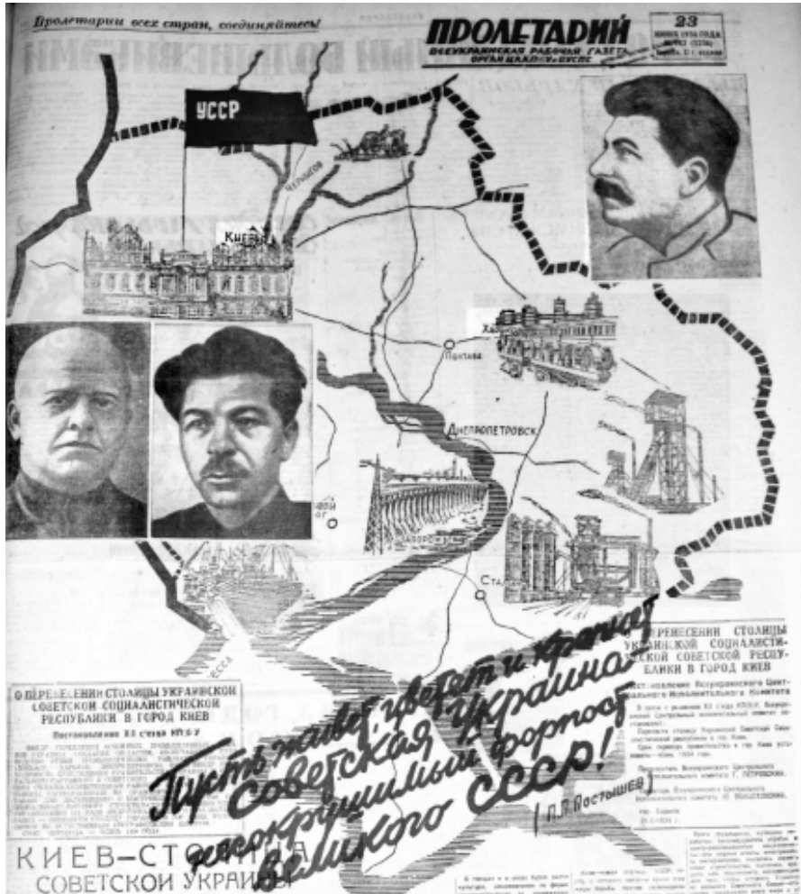
Один з цієї «трійки» (зліва направо: С. Косіор, П. Постишев, Й. Сталін) на святковому колажі газети – автор ідеї перенесення столиці. Не виключено, що ним був П. Постишев.

інститутів готують під центральні установи з Харкова. Намагаючись погасити паніку, у Жовтневому районі Києва обнародували плани перспективного будівництва. Мовляв, Київ лише виграє від переведення столиці, дивіться, скільки всього буде збудовано! Працівника райради негайно притягли до суду за розголошення державної таємниці (!), а рештки накладу районної газети оперативно вилучили... Окрім таємничості, вражає і швидкість