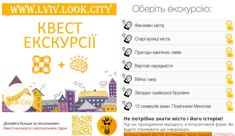
Рисунок 1 – Фрагменти рекламної пропозиції квест-екскурсії із віртуальним гідом туристично-івентової компанії Just Lviv It

Створення та просування ІТ-продуктів, що спеціалізуються на квест-екскурсіях із віртуальним гідом, – перспективний міждисциплінарний напрямок. Стартапи, створені задля побудови таких додатків, легко масштабуються й у разі грамотної маркетингової стратегії можуть бути дуже успішними. На