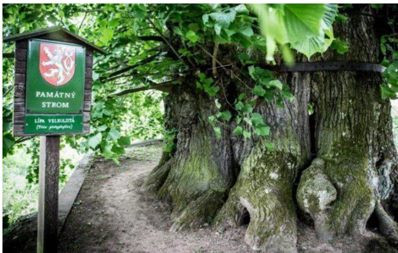
Мал.1.10 «Храснова Ліпа»