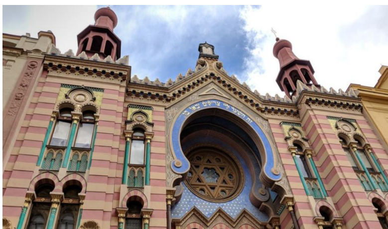
Мал.1.3 «Єврейський квартал»