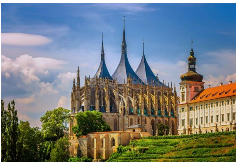
Мал.1.5 м. Кутна Гора