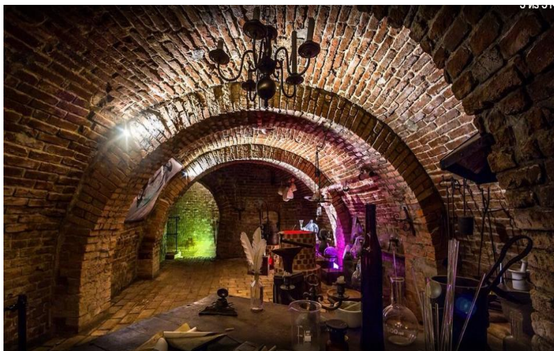
Мал.1.7 «Лабіринт під землею»