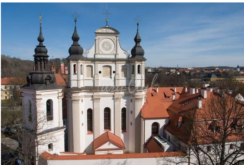
Мал.2.4 «Костел Святого Міхаеля» в Оломоуці