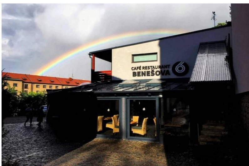
Мал. 3.2 Готель «Hotel Apartments Benešova 6» у м. Кутна Гора