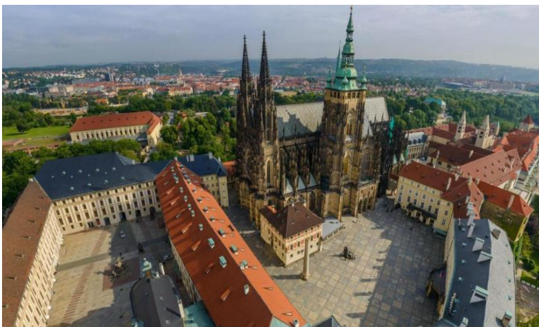
Мал.1.4 «Празкий Град»