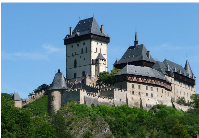
Мал.2.1 «Замок Карлштейн»