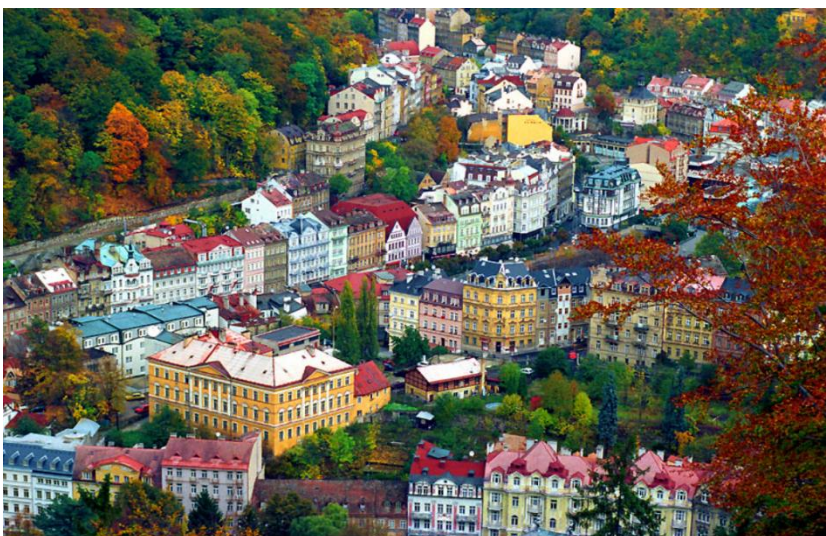
Мал.2.5 «Карлові Вари»