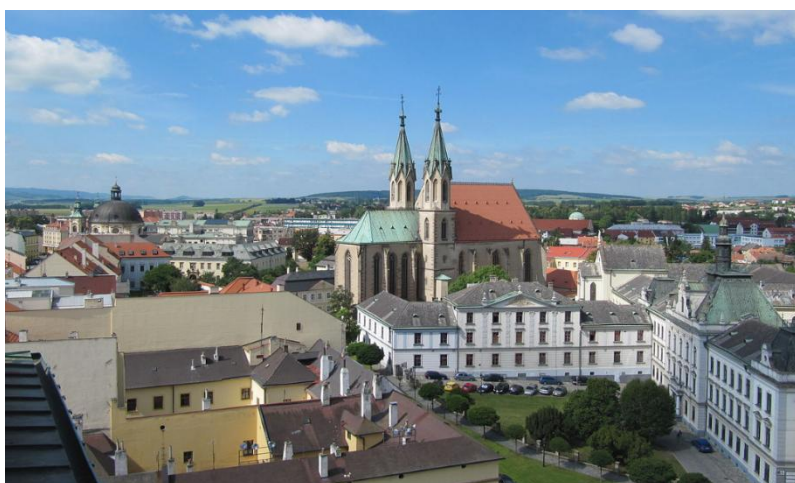
Мал.2.2 м. Кромержиж