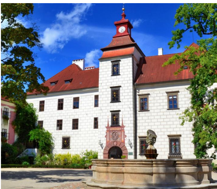
Мал.1.6 «Замок Шпильберк»