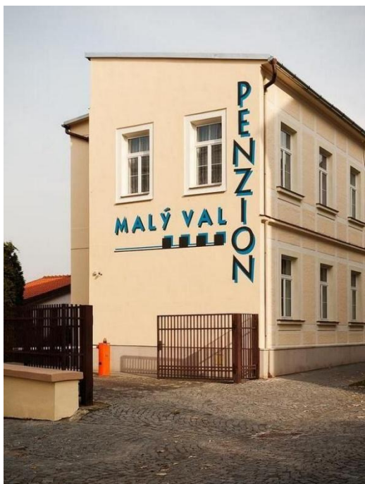
Мал.3.4 Готель «Penzion Malý Val» у м. Кромержиж