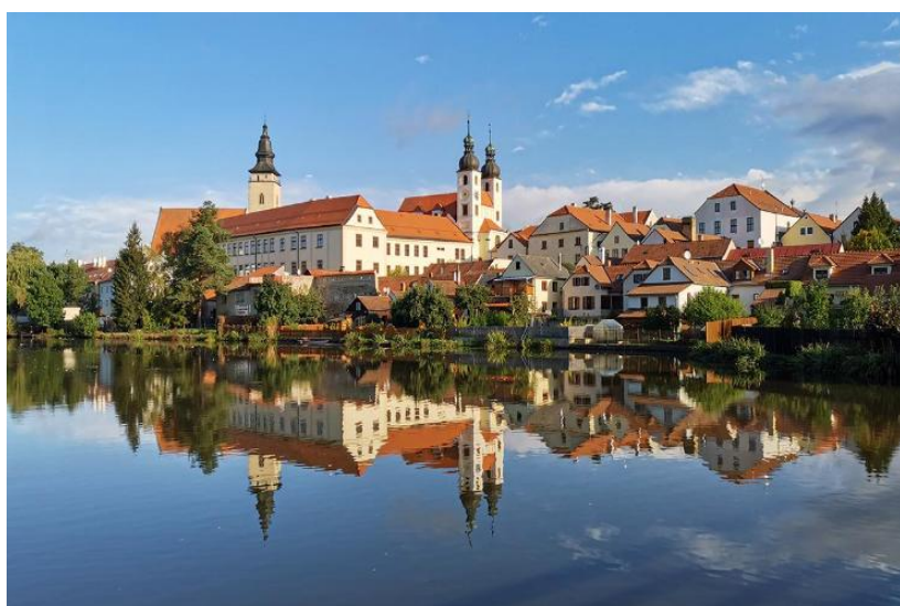
Мал.1.9 м. Тельч