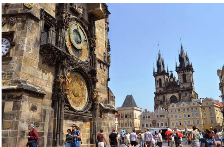
Мал.1.1 «Празький годинник»