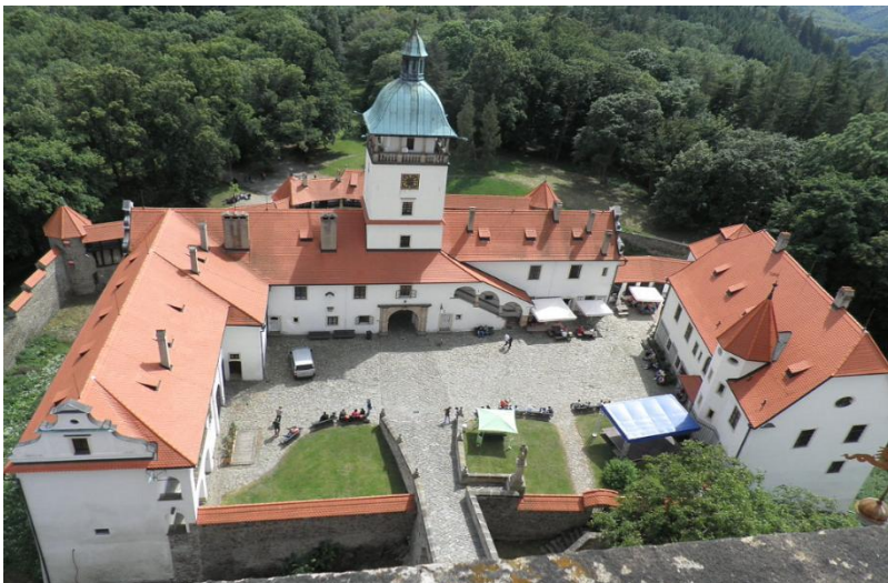
Мал.2.3 «Замок Оломоуцького краю»