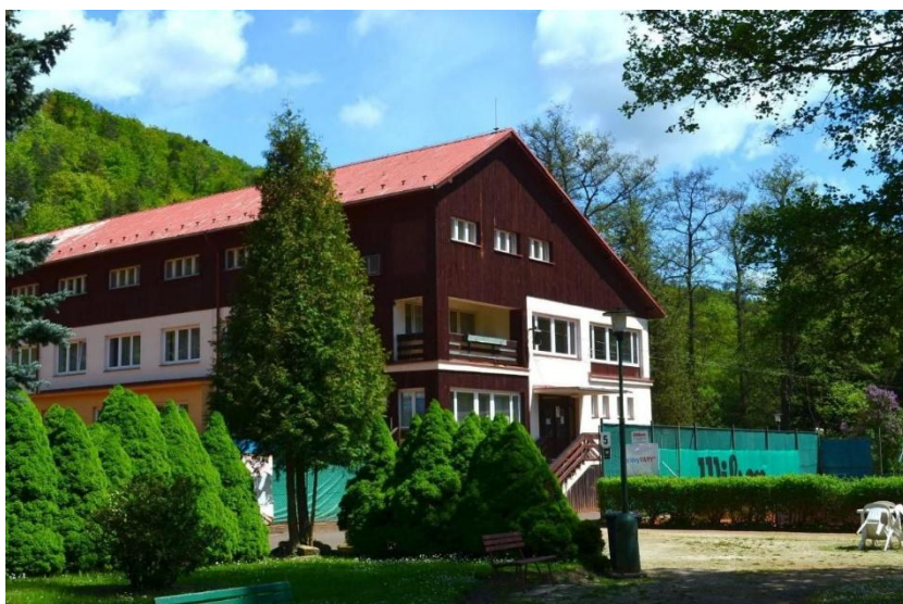
Мал.3.5 Готель «Sport Hotel Gejzírpark» у м. Карлові Вари