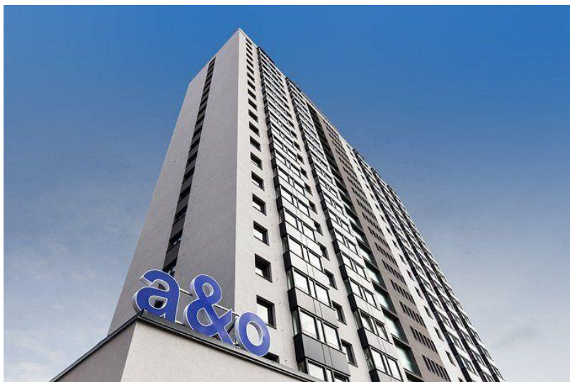
Мал.3.1 Готель«А&О Prague Rhea» у Празі