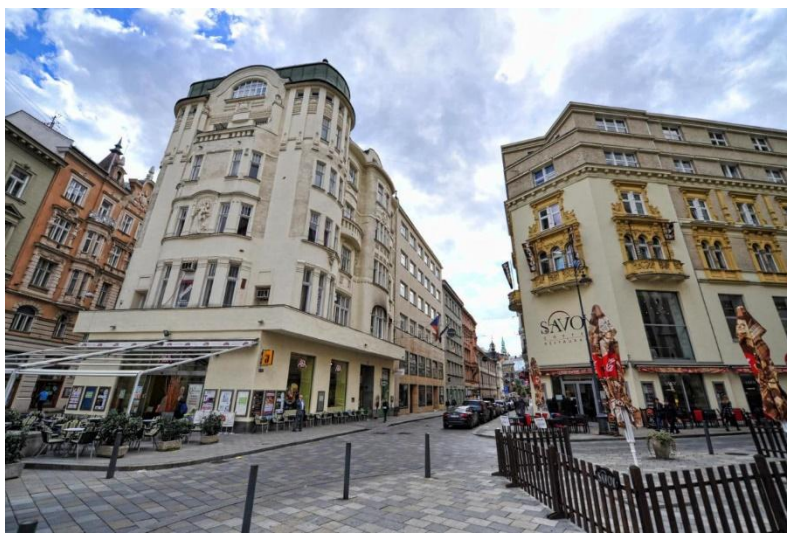
Мал.3.3 Готель «Артмáновý Дům Centrum» у м. Брно