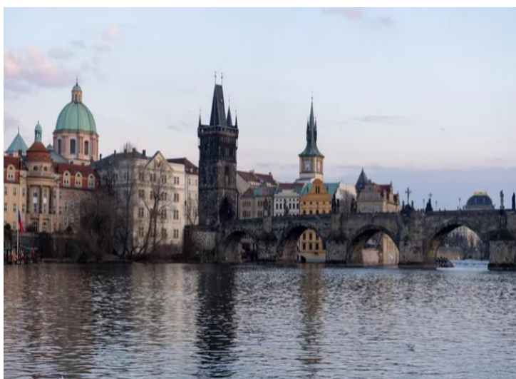
Мал.1.2 «Карлів міст»