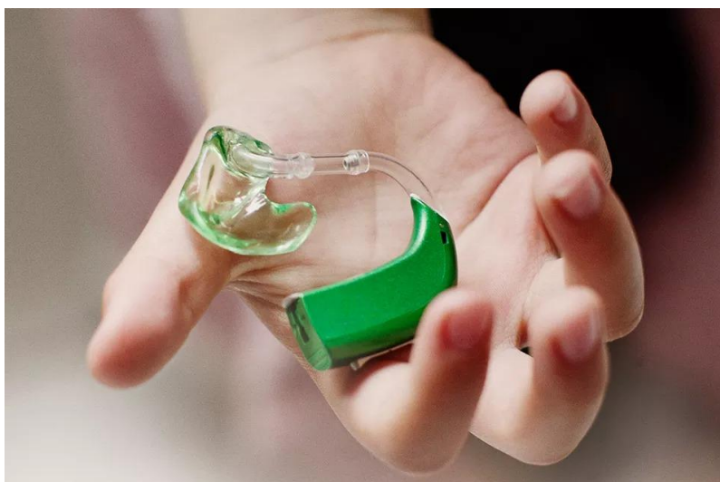
Рис. 1.4 Слуховий апарат

Проте частіше глухі люди комунікують у межах закритих спільнот, де всі знають особливості сприйняття інформації людьми з порушеннями слуху. У цій спільноті вони можуть зустрічатися з людьми з подібними проблемами, обмінюватися досвідом та підтримкою, а також вивчати спеціальну мову - жестову мову. Суспільство поступово стає більш освіченим та дружнім до