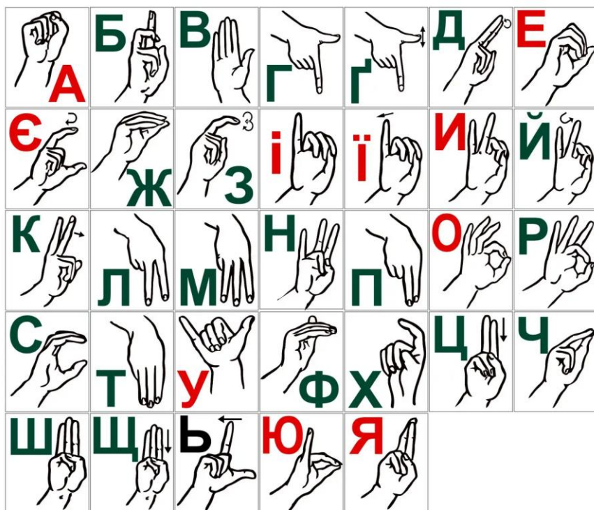
Рис. 1.1 Українська дактильна азбука

Також жестами позначаються не лише літери, але й цілі лексеми. Приклад можна побачити на відео за посиланням, що зашифровано у QR-кодi на рисунку 1.2.