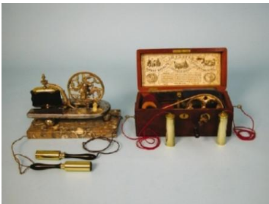
Рис. 1.7 Пристрій для електротерапії

Вважалося, що електрика може виправити глухоту, спричинену паралічем слухових нервів, що перешкоджає правильній передачі звукових коливань до барабанної перетинки [55]. Приклад пристрою для електротерапії можна побачити на рис. 1.7.