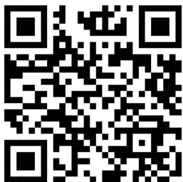
Рис.1. 2 Відео-привітання жествою мовою

Також жестами позначаються не лише літери, але й цілі лексеми. Приклад можна побачити на відео за посиланням, що зашифровано у QR-кодi на рисунку 1.2.