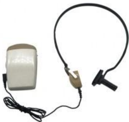
Рис. 1.3 Кишеньковий слуховий апарат

як слухові апарати (рис. 1.3 та 1.4), кісткові провідні пристрої та імплантати, щоб поліпшити своє сприйняття звуку.