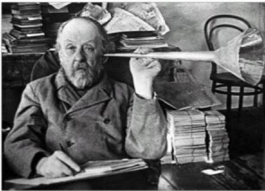
Рис. 1.6 Вушні труби

Однак ці пристрої, як правило, були громіздкими і потребували фізичної підтримки знизу. Пізніше як слухові апарати використовували менші ручні вушні труби та конуси” [55]. Приклад можна побачити на рис. 1.6.