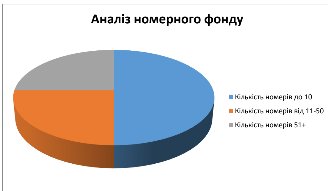
Рис. 1 Аналіз номерного фонду концептуальних готелів України

Як ми переконалися, концептуальні готелі – найкращий вибір для того, хто хоче відчувати «вау»-ефект не тільки в обслуговуванні, а й у дизайні. Є багато людей, які готові вдягнути шкуру хом'яка, стати бранцями або лицарями, носити корони або жебраками і платити за яскраві враження, що отримують від відпочинку та подорожей. Тому в цьому розділі ми вирішили оцінити концептуальні готелі порівняно з класичними [9]. На діаграмінаведено коефіцієнти місткості досліджуваних готелів (Рисунок 1).