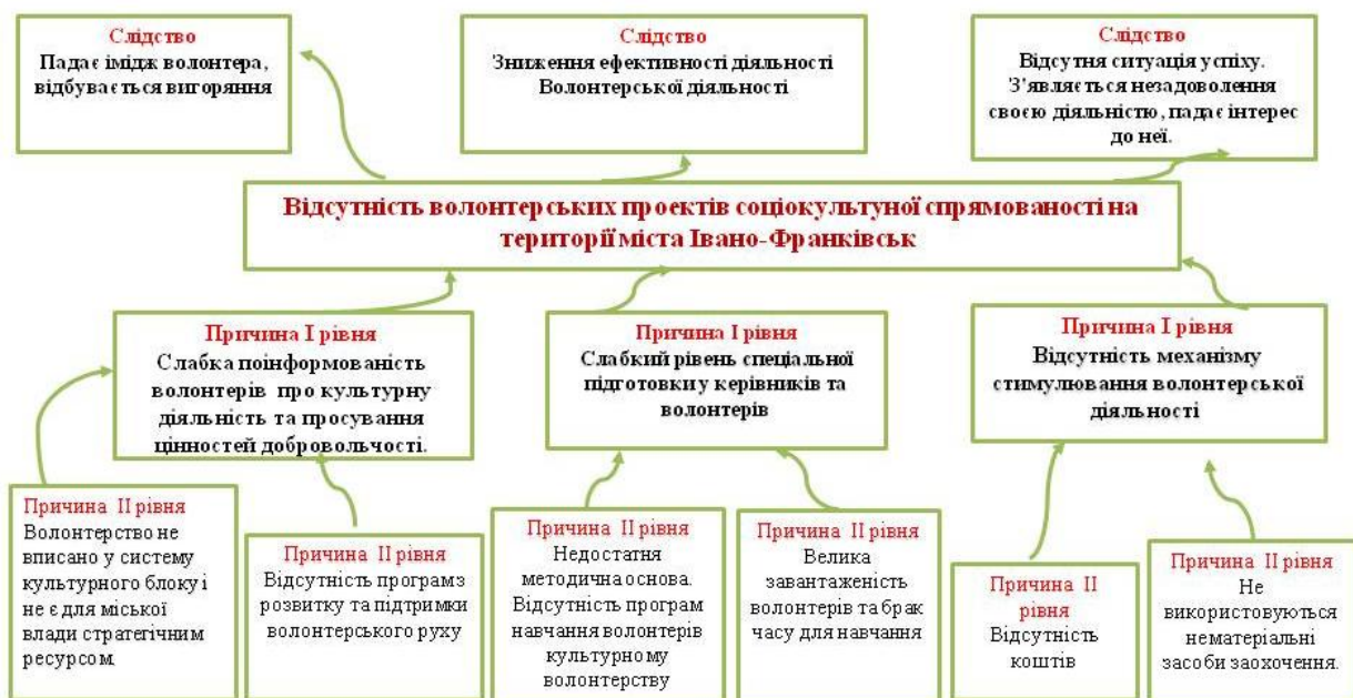
Рисунок 1. Карта проблем

Багато в чому нечисленність цього об'єднання є наслідком слабкої просвітницької діяльності щодо ролі функціонування цього руху «Волонтери культури».