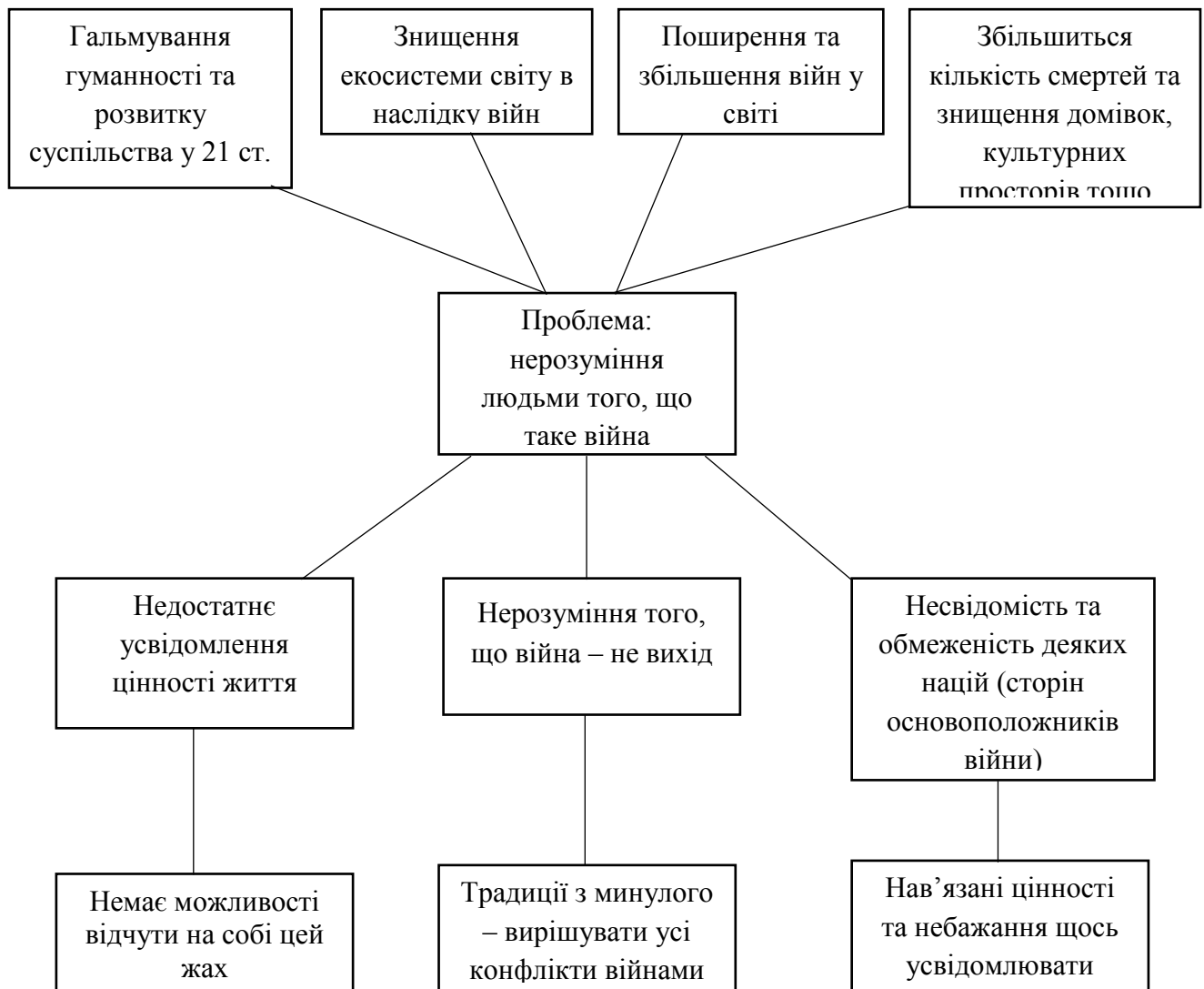
Рис. 2.1. Дерево проблем

Для того, щоб зануритись у створення проєкту, необхідно визначити більш детально усі його проблеми та обдумати способи вирішення. Для цього розроблено «Дерево проблем», що дозволить оглянути ці питання в цілому.