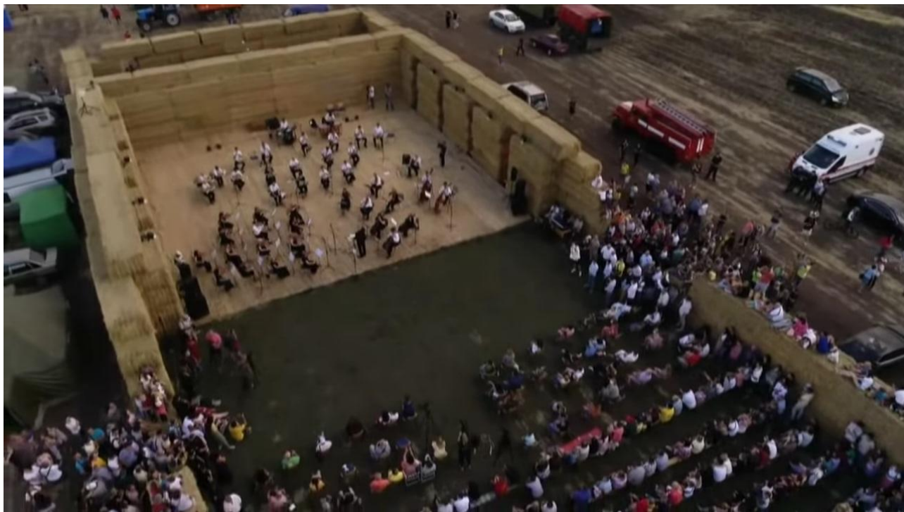
Рис. Д.1. Вигляд імпровізованої сцени з сіна з висоти