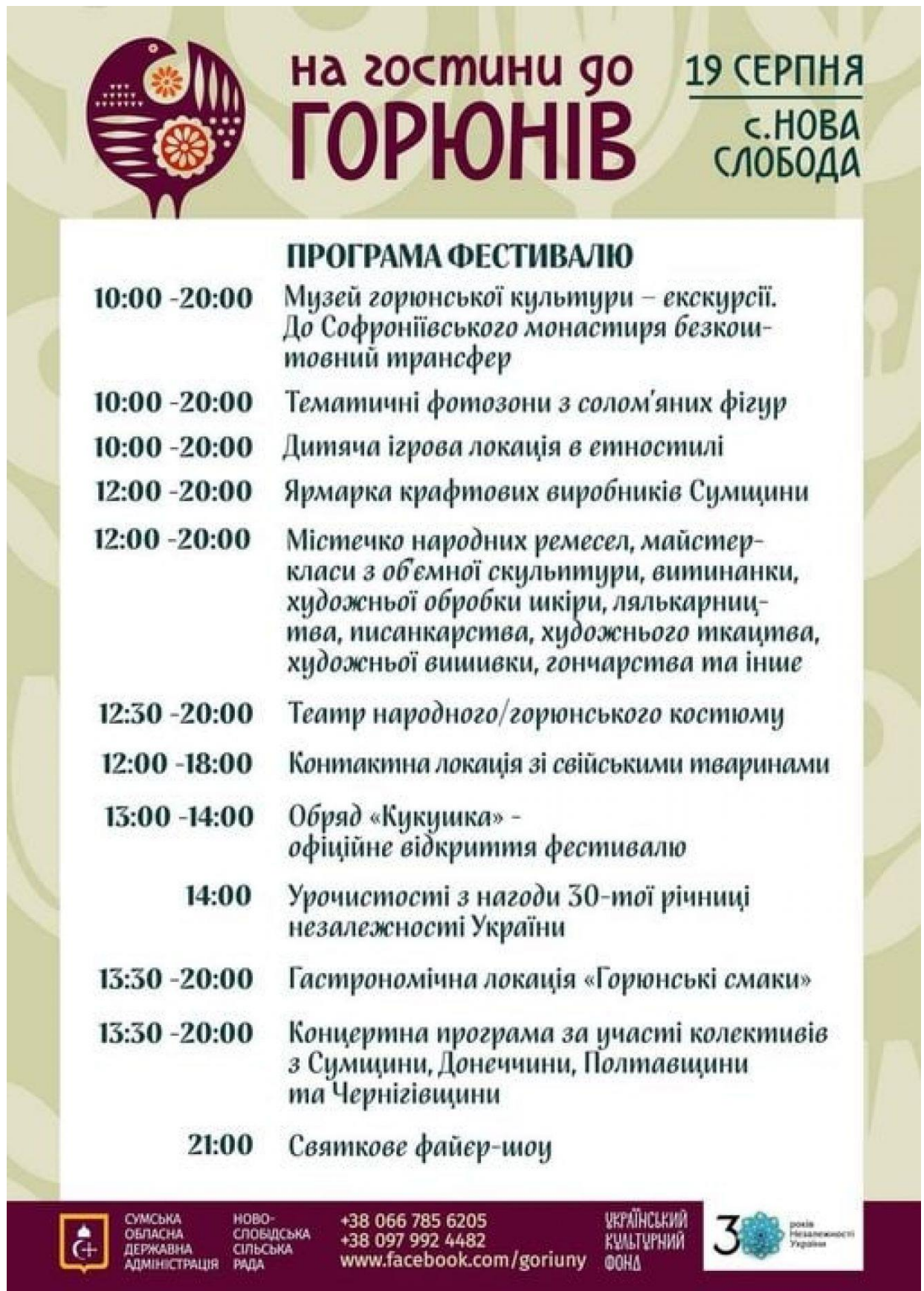
Рис. Г.8. Програма фестивалю