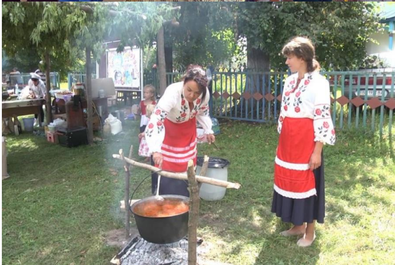
Рис. Г.6. Демонстрація страв горюнів