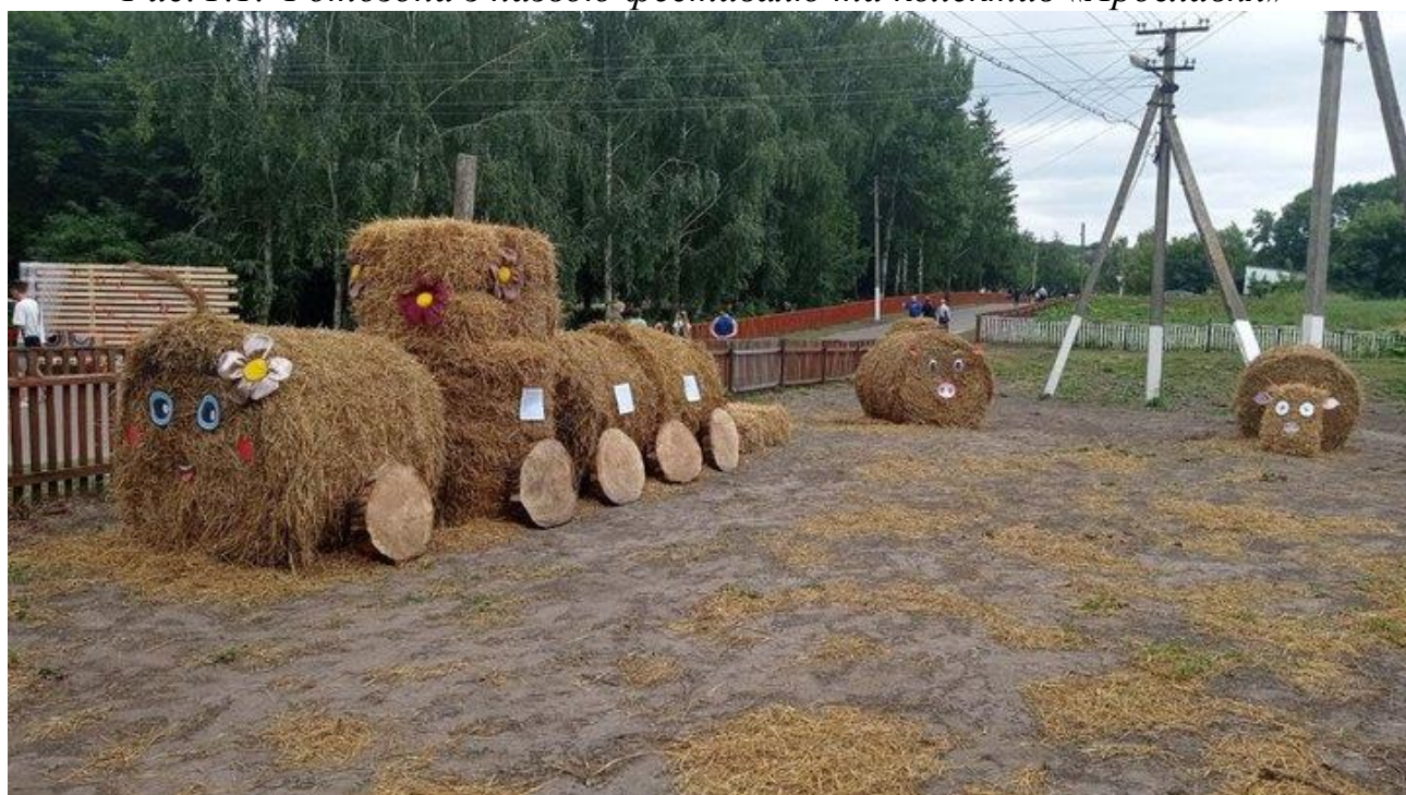
Рис. Г.2. Фотозона мешканців Червоноозерського старостинського округу