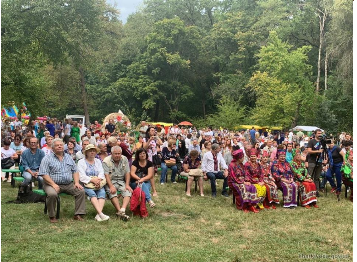
Рис. В.1. Проведення фестивалю на лісовій галявині