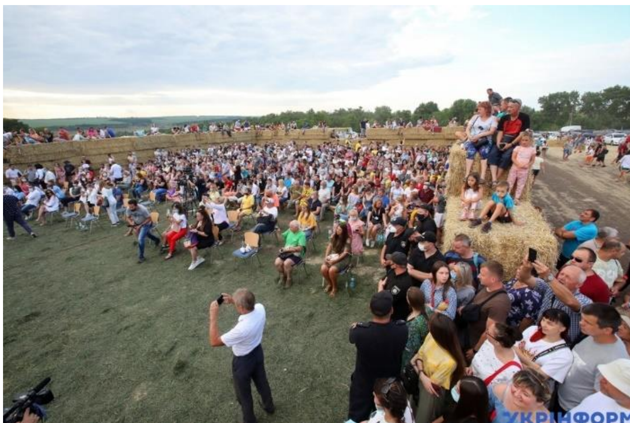
Рис. Д.5. Вид на глядацьку залу