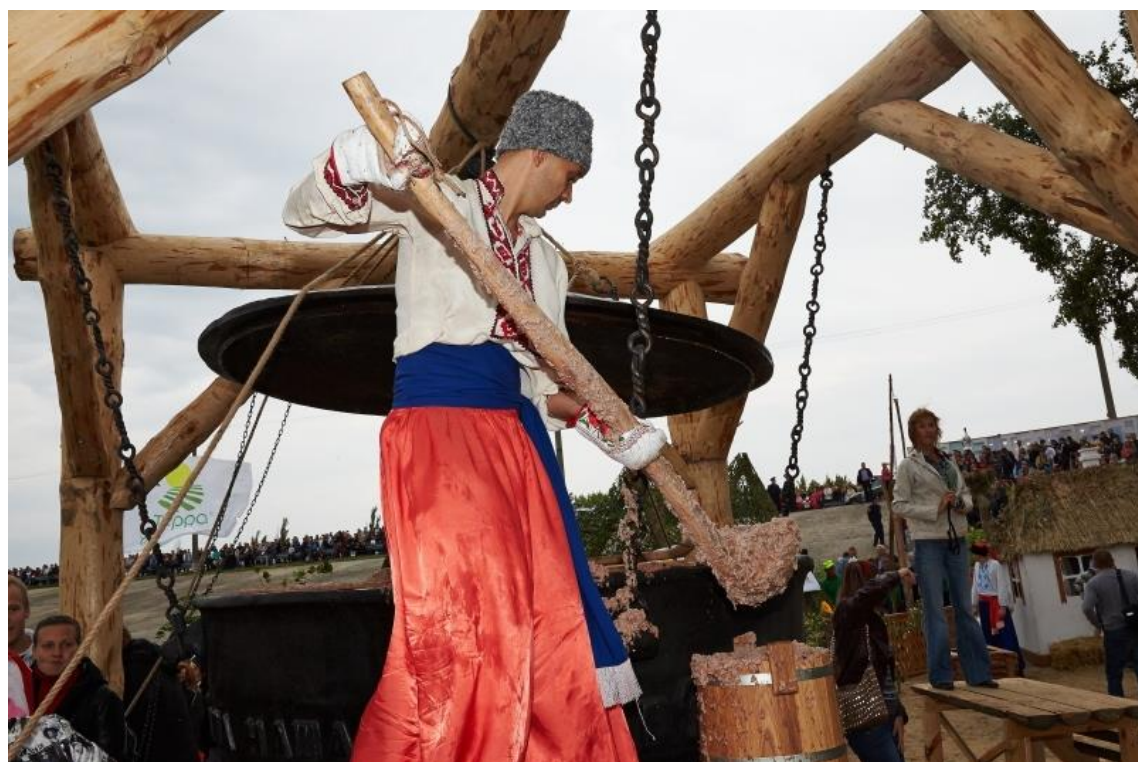
Рис. А.3. Козацькі кухні серед поля