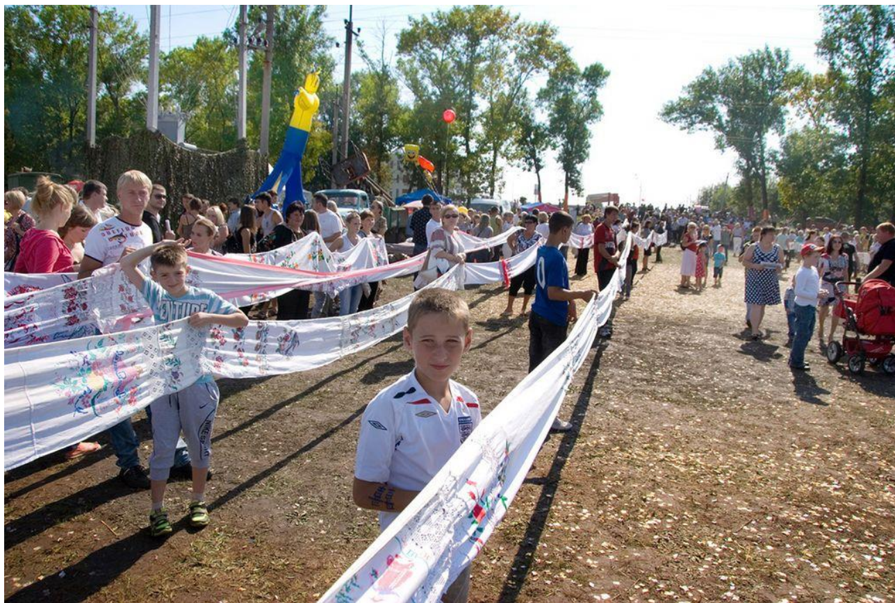
Рис. Г.3. Найдовший весільний рушник на фестивалі «Весілля в Малинівці» 2012 року