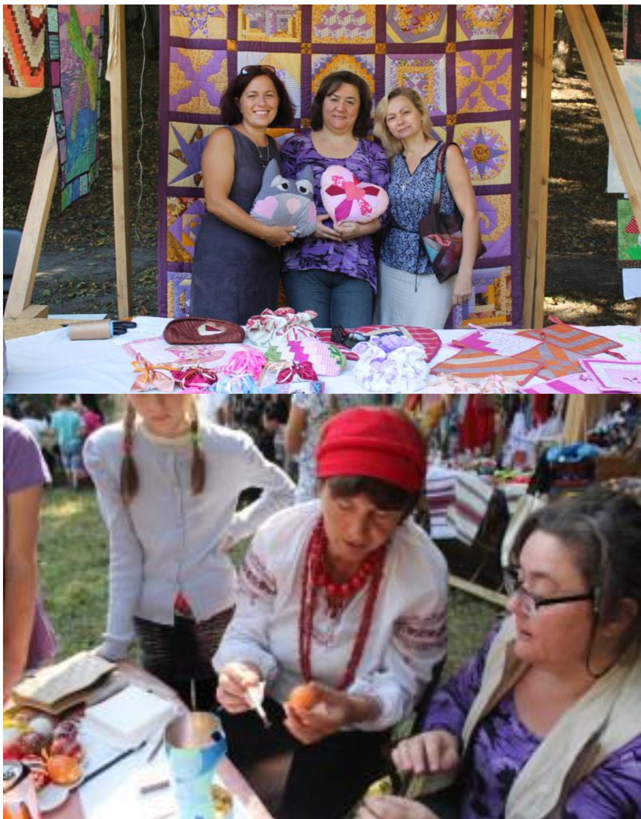
Рис. В.3. Столики ремісників та майстрів народного господарства