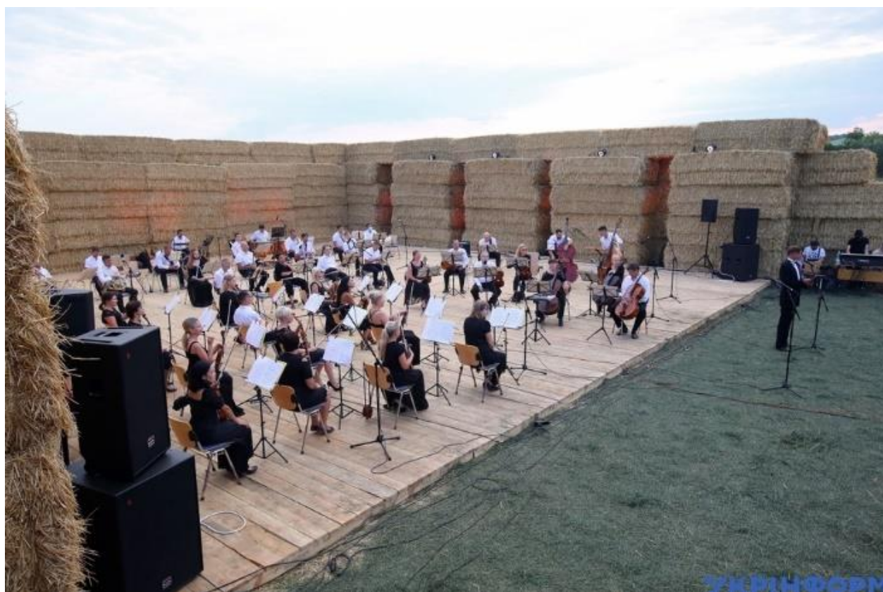
Рис. Д.4. Сцена у сіні від збоку