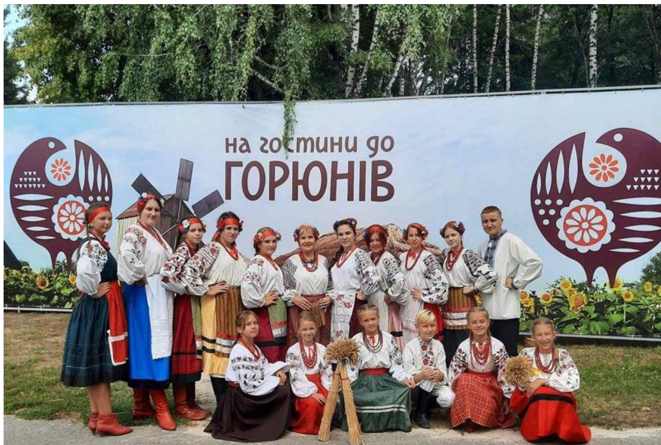
Рис. Г.1. Фотозона з назвою фестивалю та колектив «Ярославня»