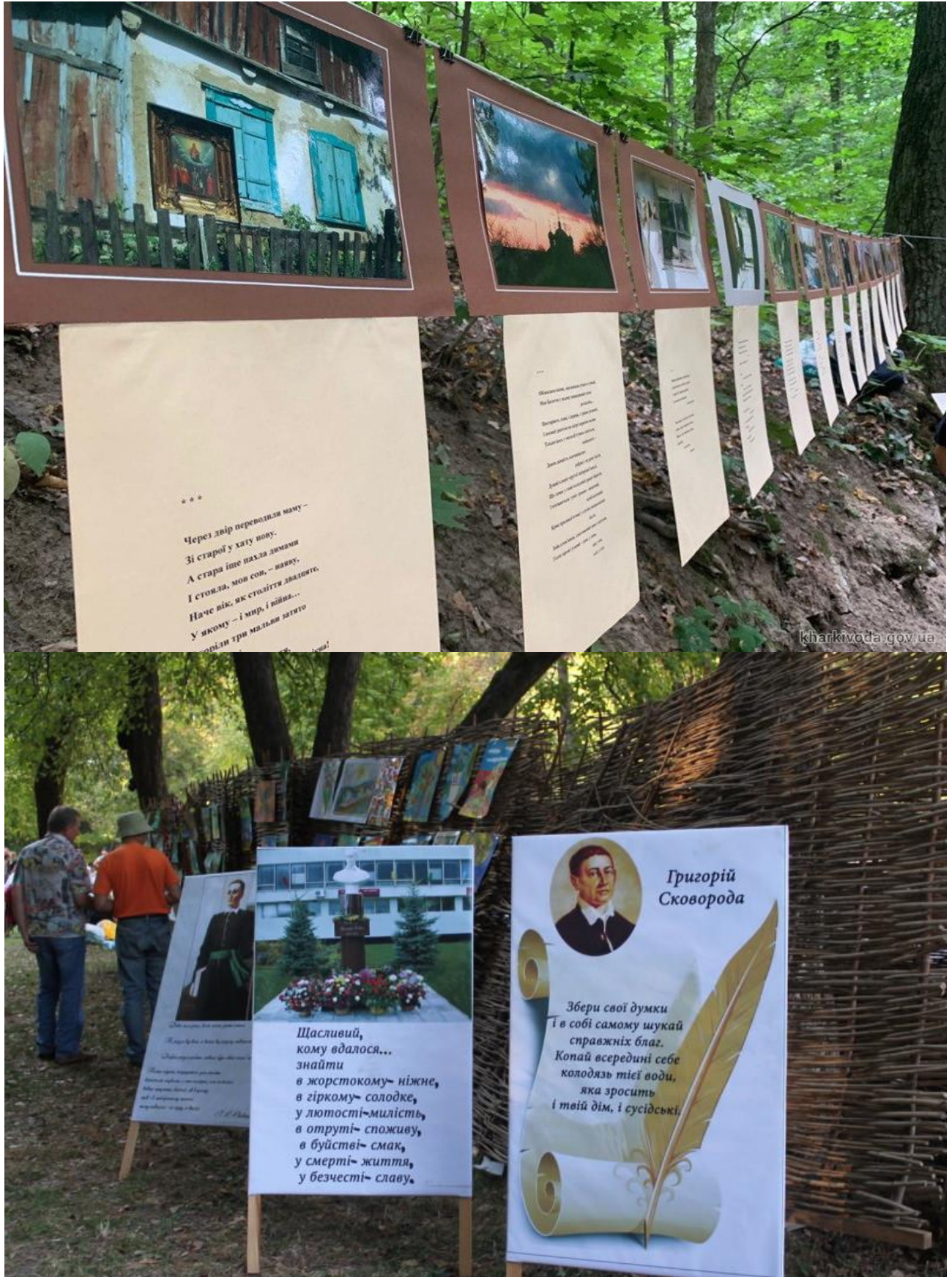
Рис. В.2. Роздруківки віршів Сковороди по периметру галявину