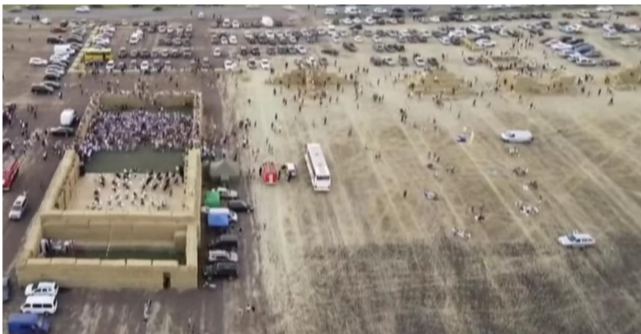
Рис. Д.3. Сцена зліва, справа зона для фото та дитячих ігор з сіна