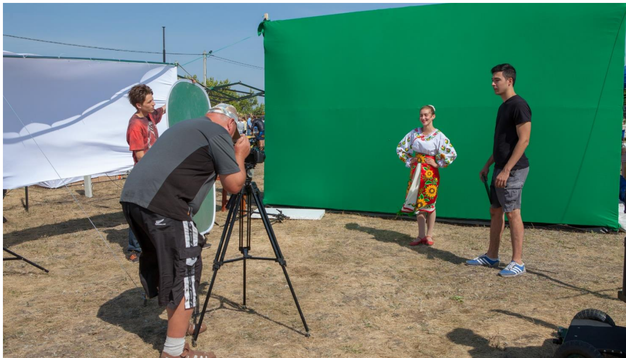
Рис. Г.1. "Весільний кінопавільйон" із проведенням акторських проб