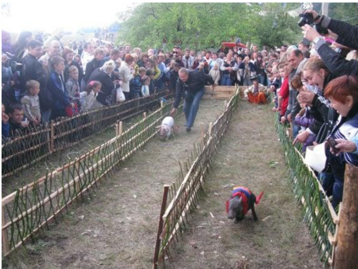
Рис. А.2. Спеціальні загони для порсячих забігів