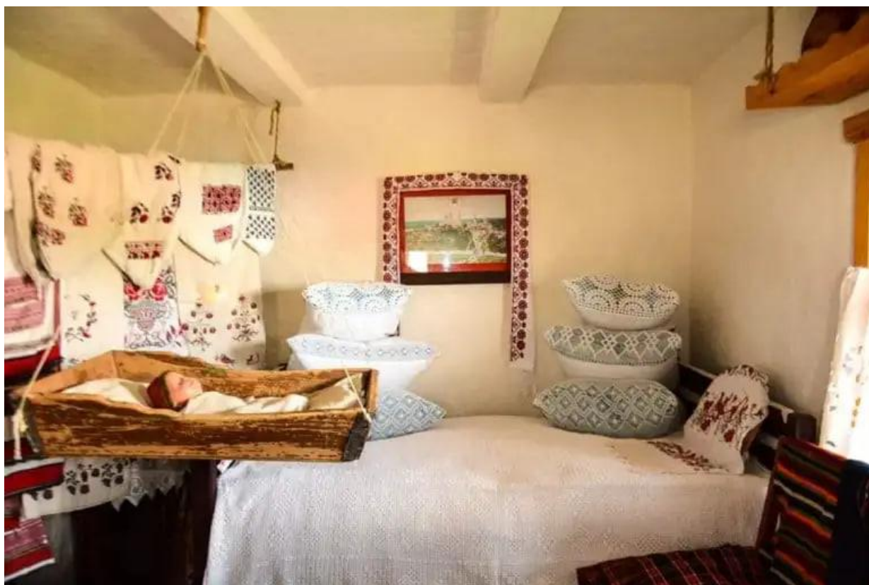
Рис. Г.4. Реконструкція житла горюнів кінця XIX - початку XX століття