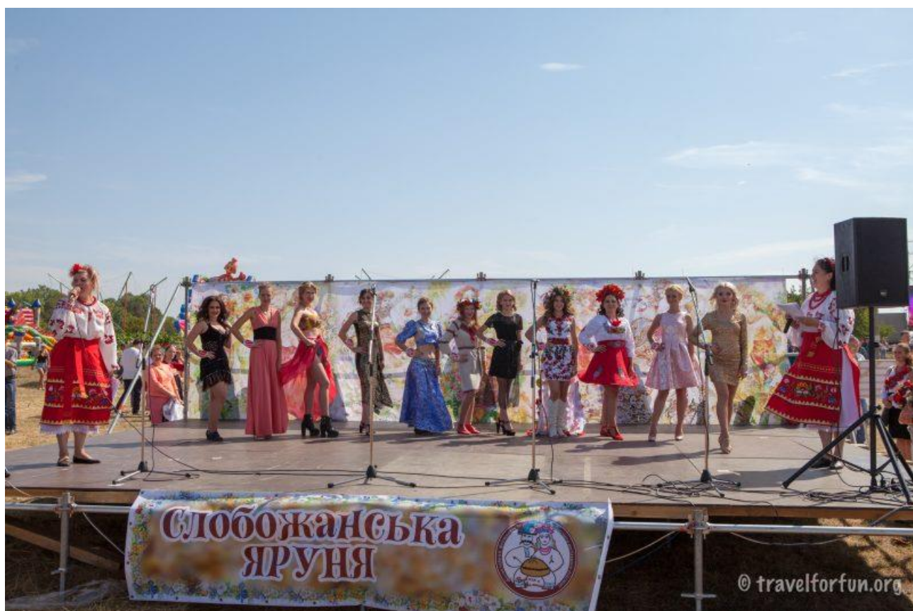
Рис. Г.5. Конкурс талантів серед дівчат «Слобожанська Яруня»