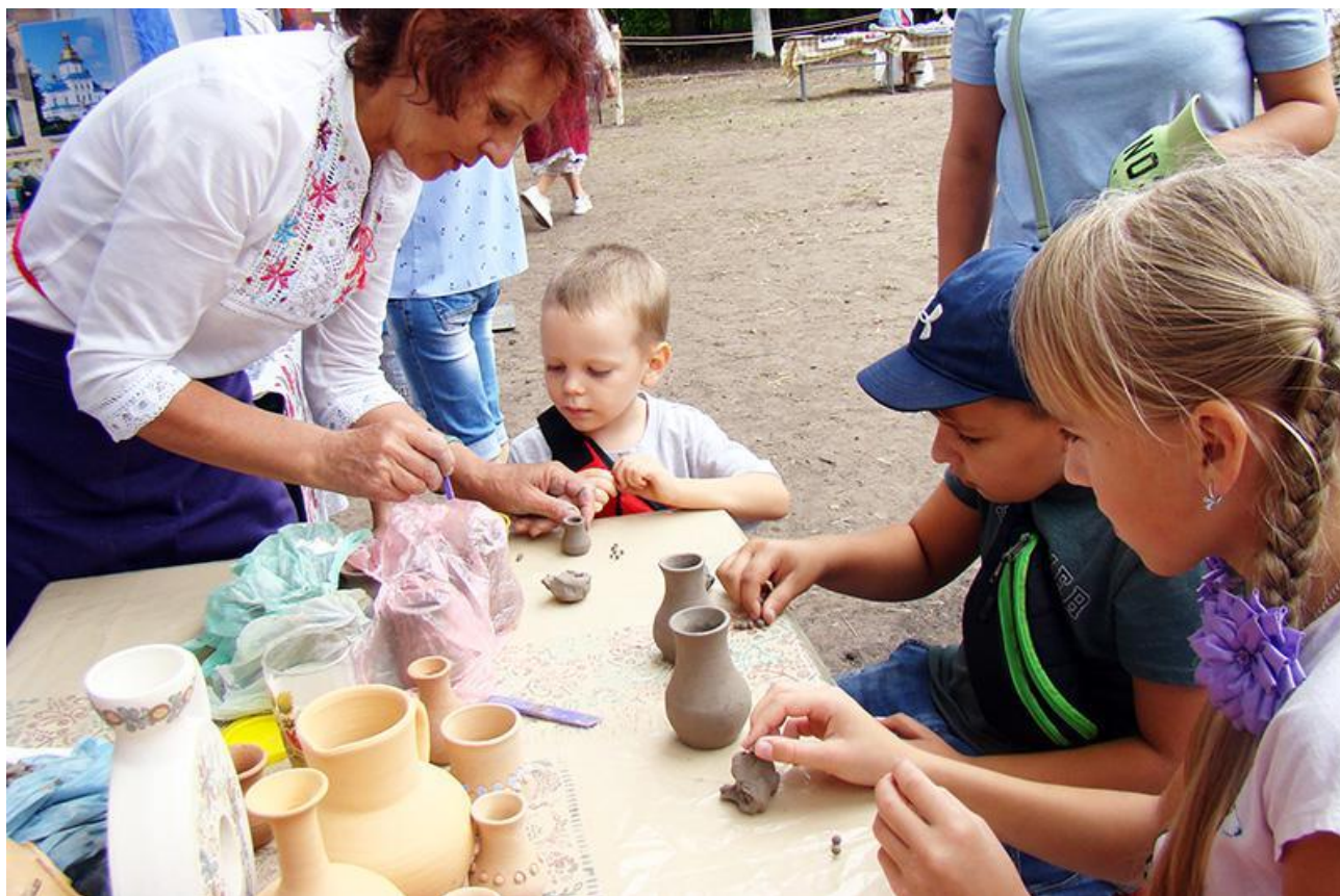
Рис. Г.7. Демонстрація ручних робіт горюнів