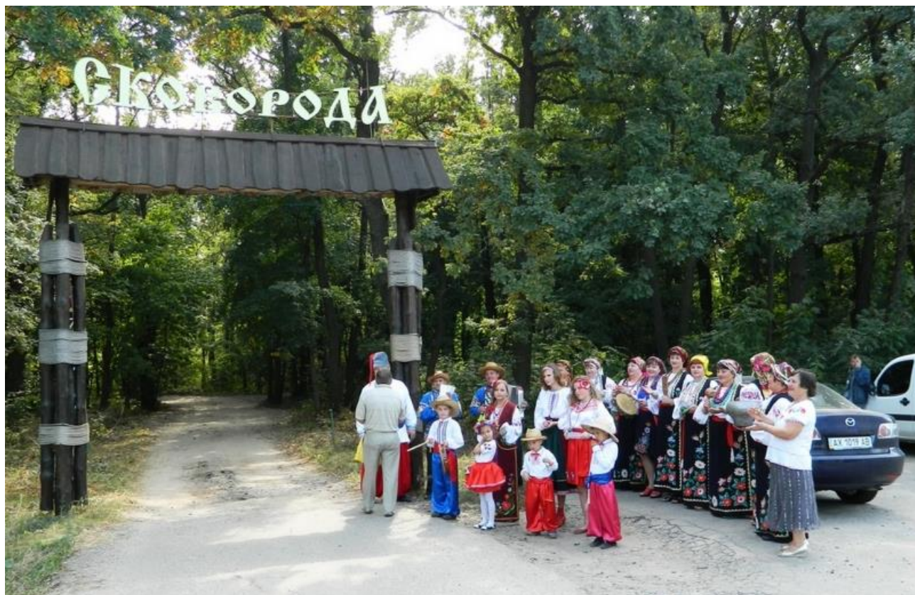
Рис. В.4. «Стежка Сковороди» в Бабаївському лісі