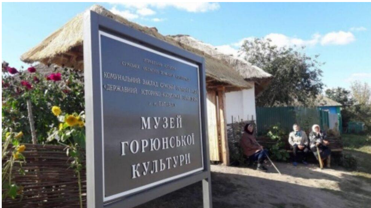
Рис. Г.3. Музей горюньської культури