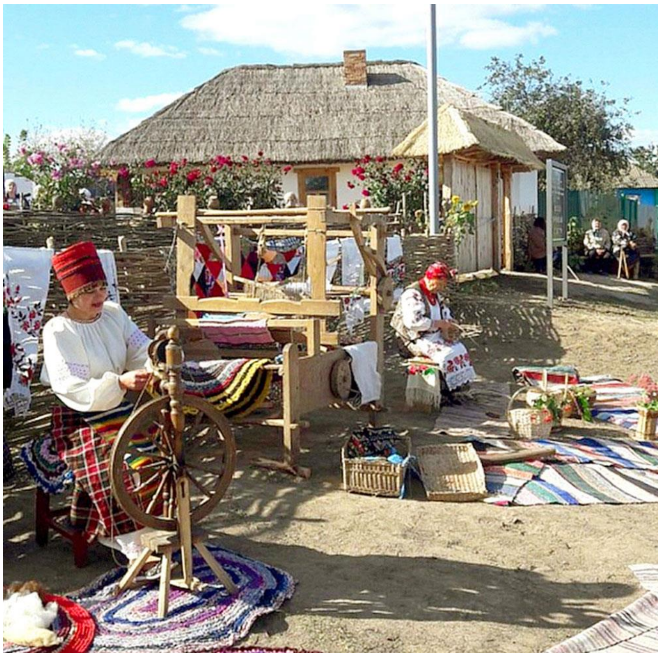
Рис. Г.5. Демонстрація ремесел горюнів