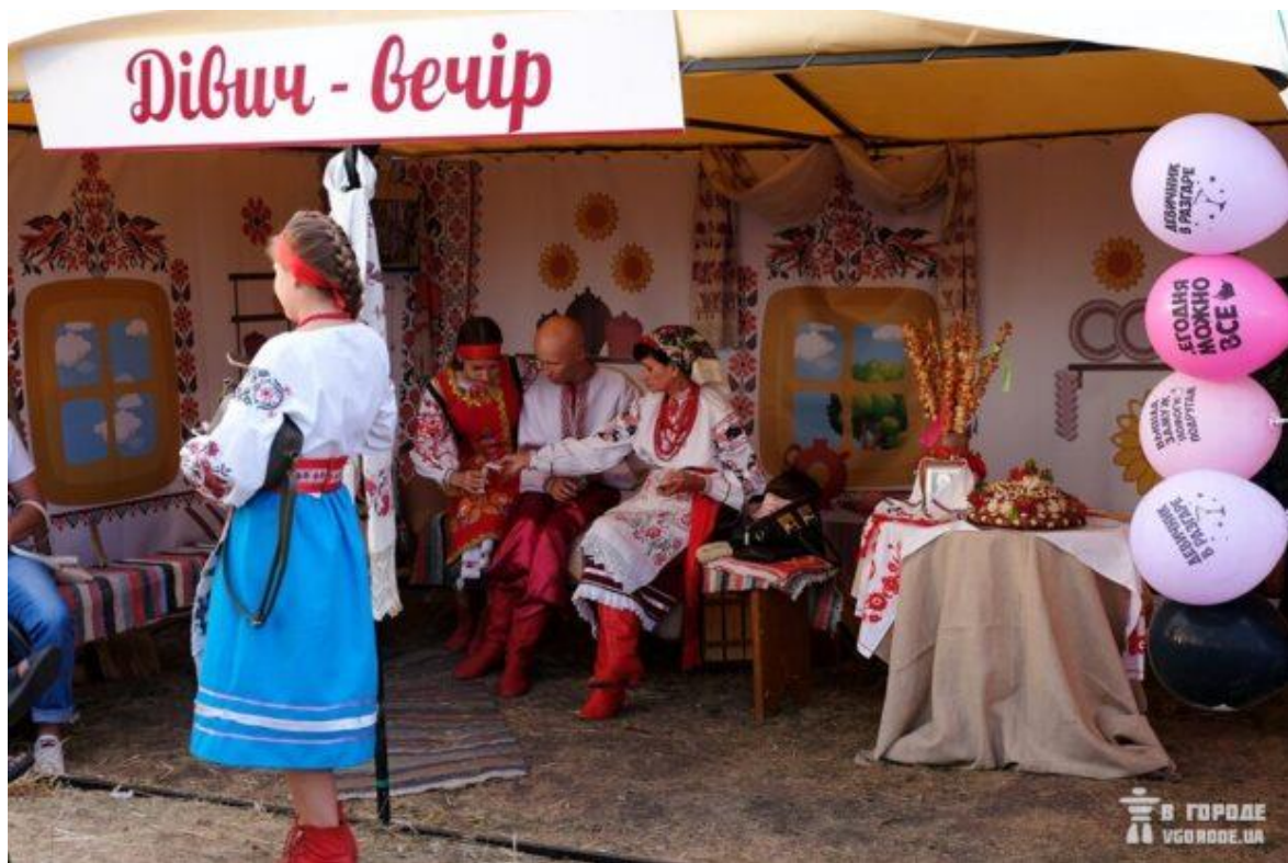
Рис. Г.4. Реконструкція двора, де очікують наречену