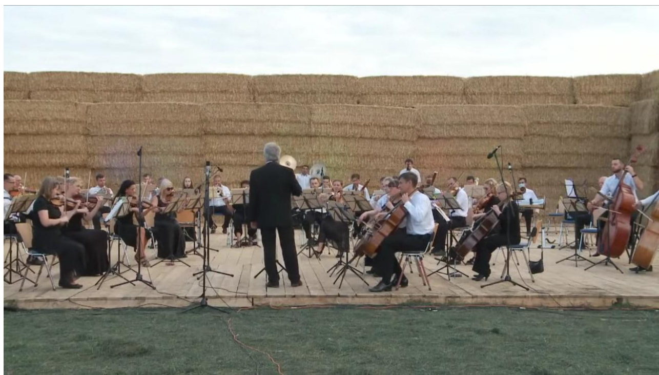
Рис. Д.2. Оркестр філармонії на сцені, яку обрамляє стіна з сіна