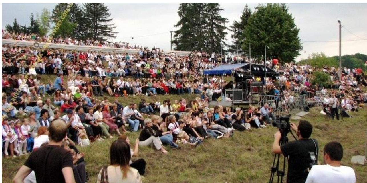
Рис. Б.2. Глядацька зала на порогах терас