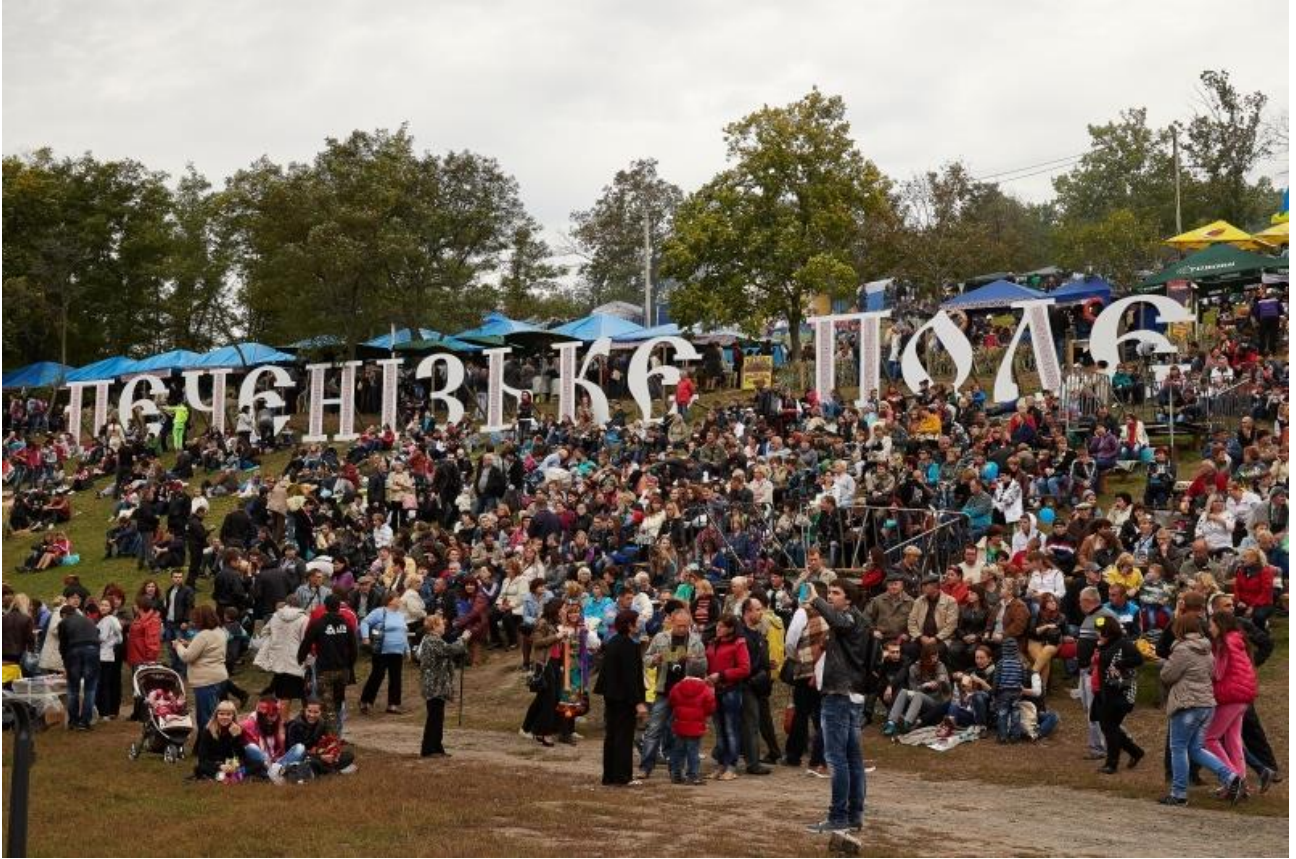
Рис. А.1. Гігантські літери на схилах