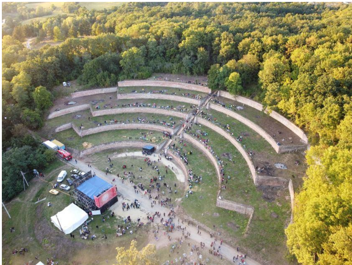
Рис. Б.3. Сцена фестивалю розташована в низині