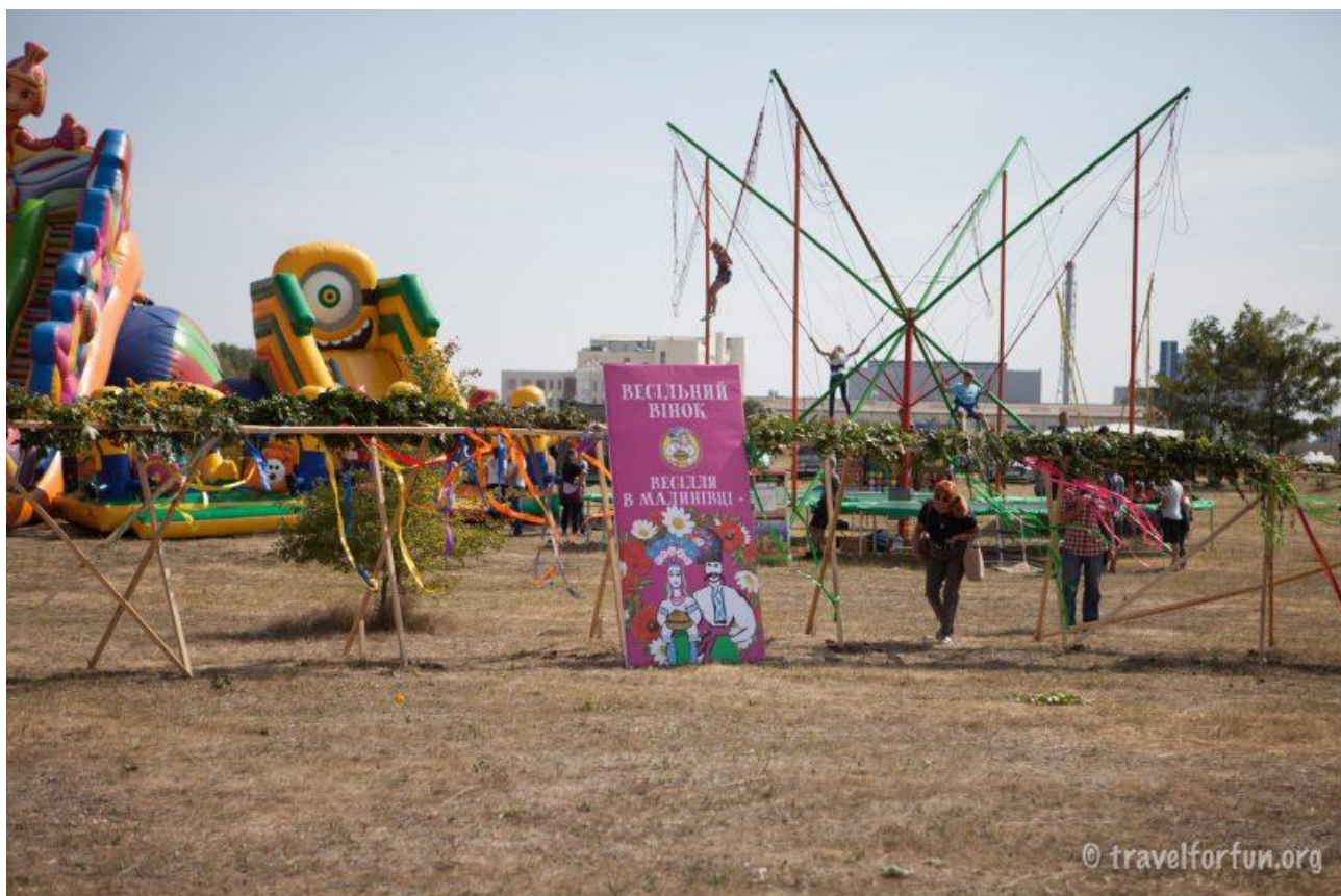
Рис. Г.2. "Вінок єдності" діаметром 20 метрів