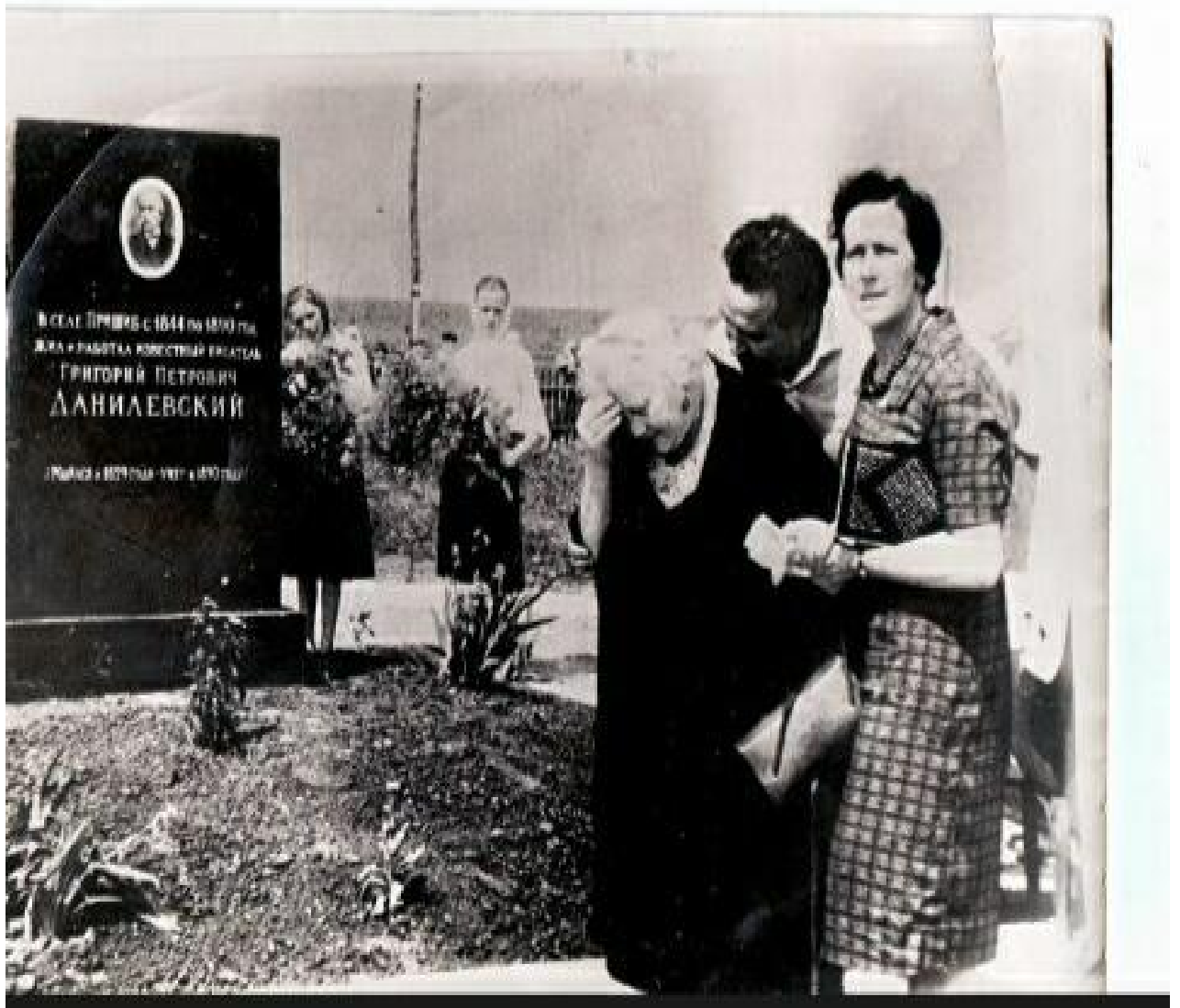
Онука та правнучка на могилі у Григорія Петровича Данилевського