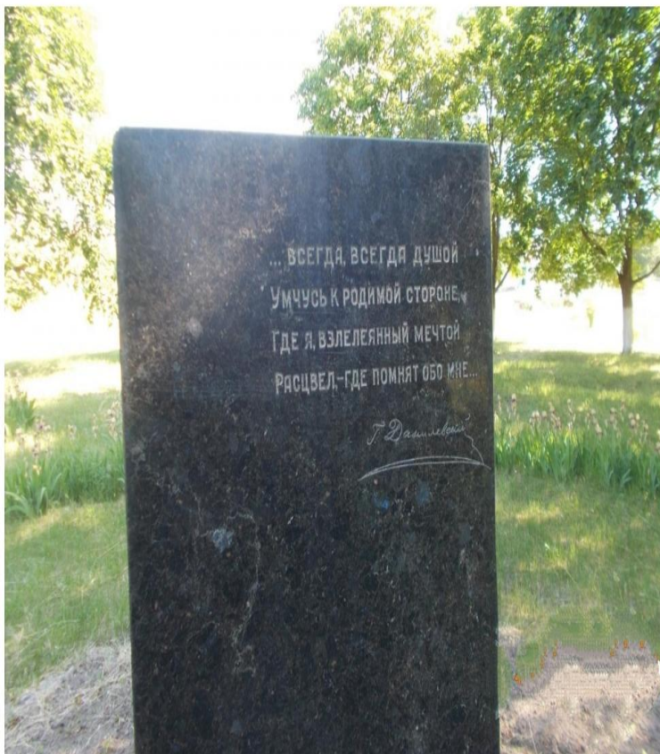
Памятник посвящений Г. П. Данилевському