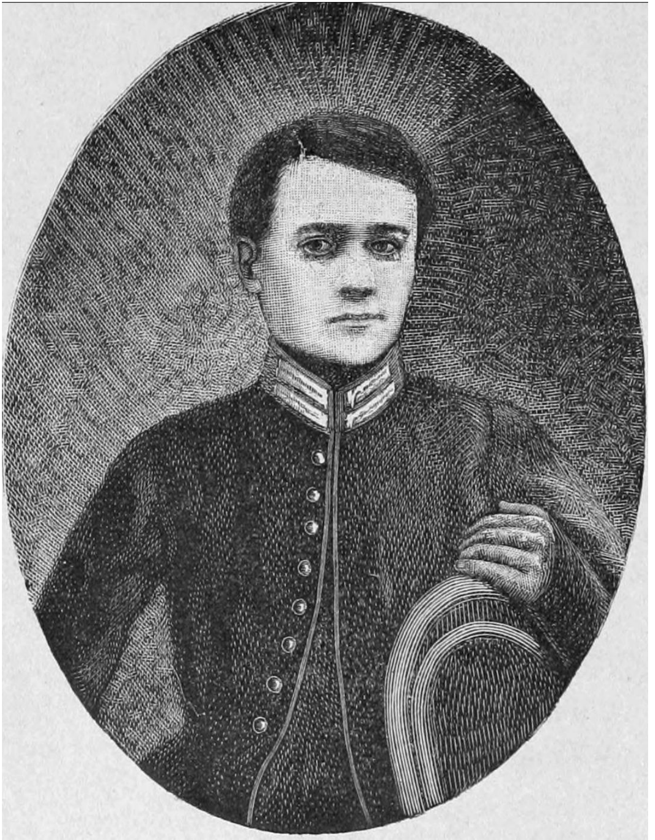
Фото портрет Г. П. Данилевський в підлітковому віці