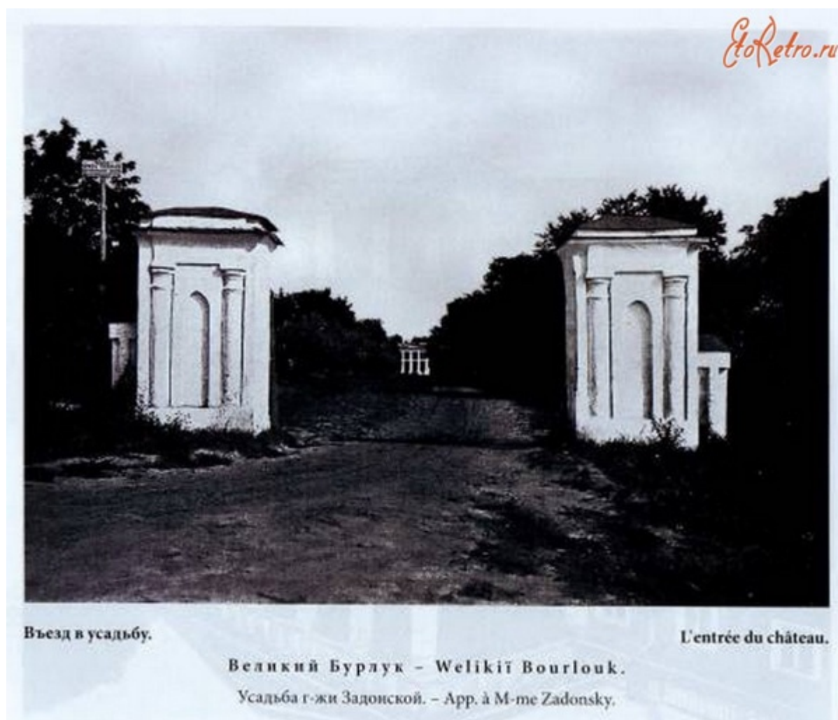
Рис. 7. В'їздні ворота до маєтку