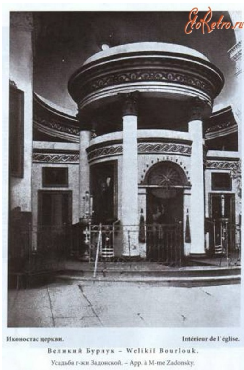
Рис. 9. Иконостас при домової церкви