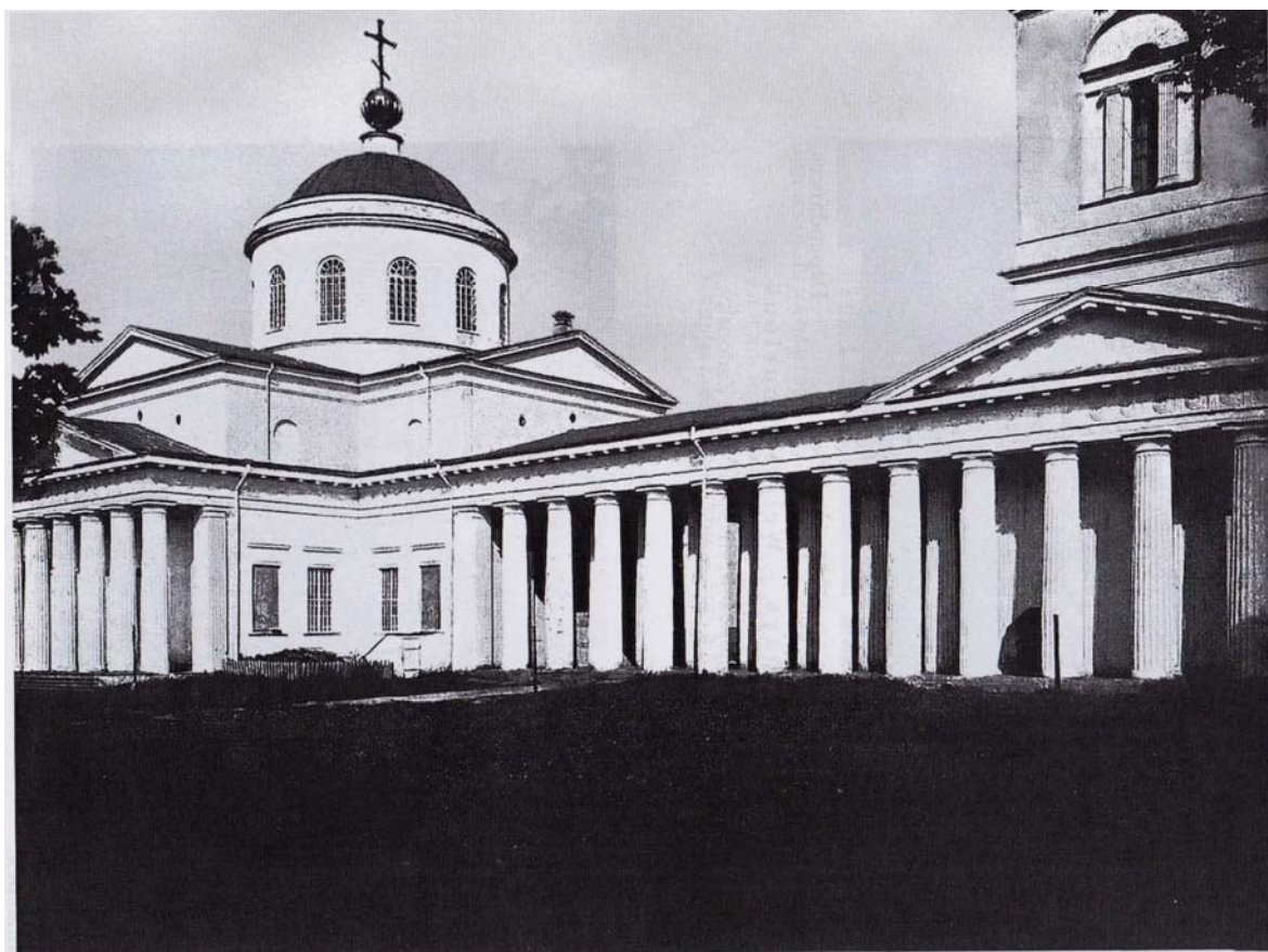
Общий вид церкви.