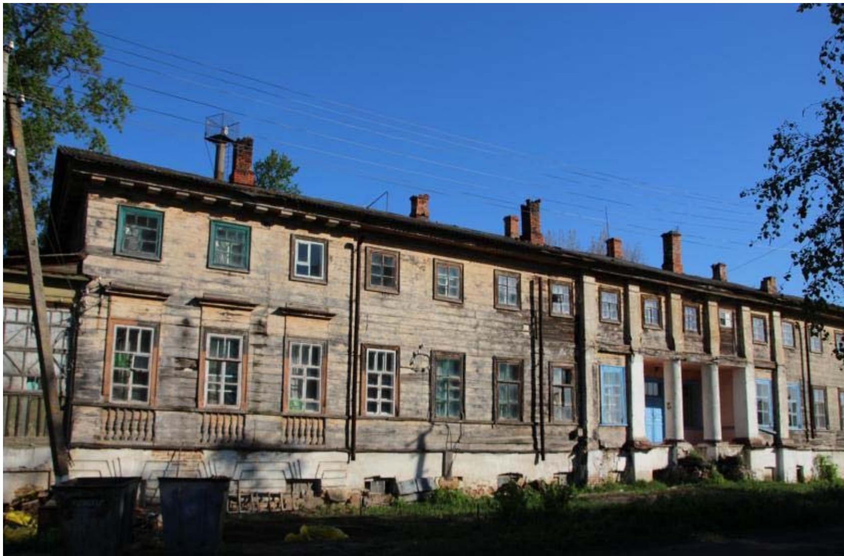
Рис. 11. Сучасний вигляд заднього фасаду маєтку