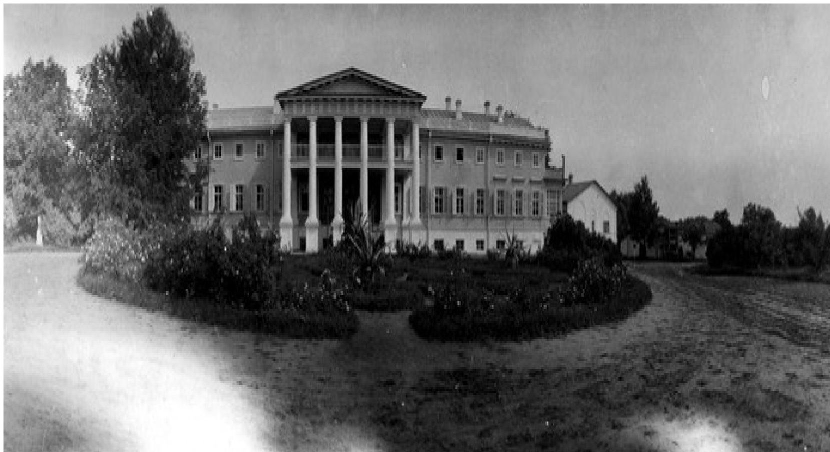
Рис. 4. Панський маєток Задонських у Великому Бурлуці