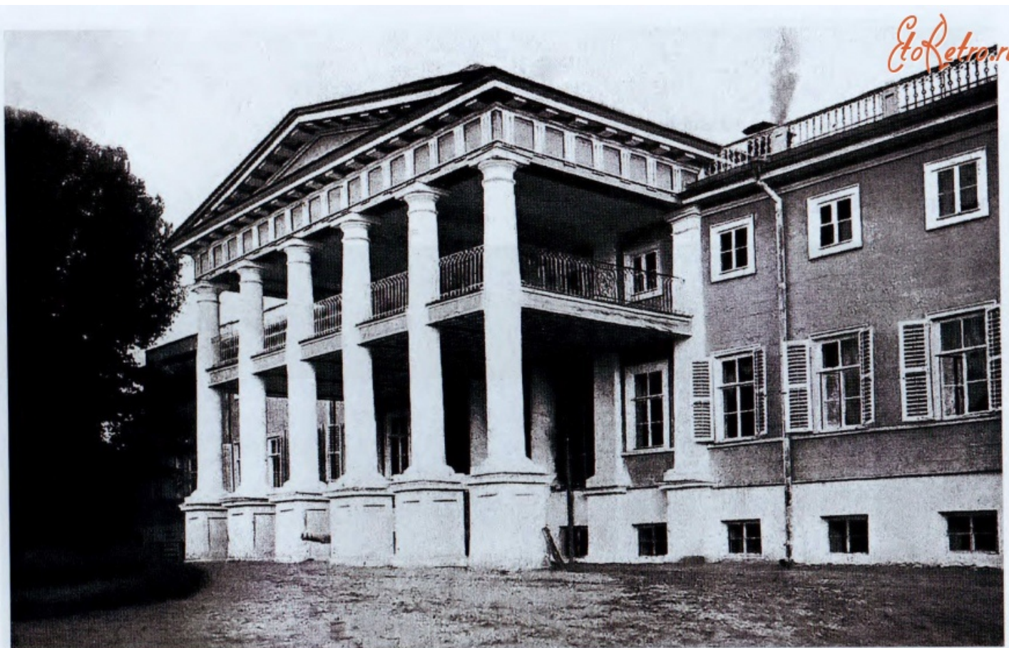
Фасад со стороны подъезда.