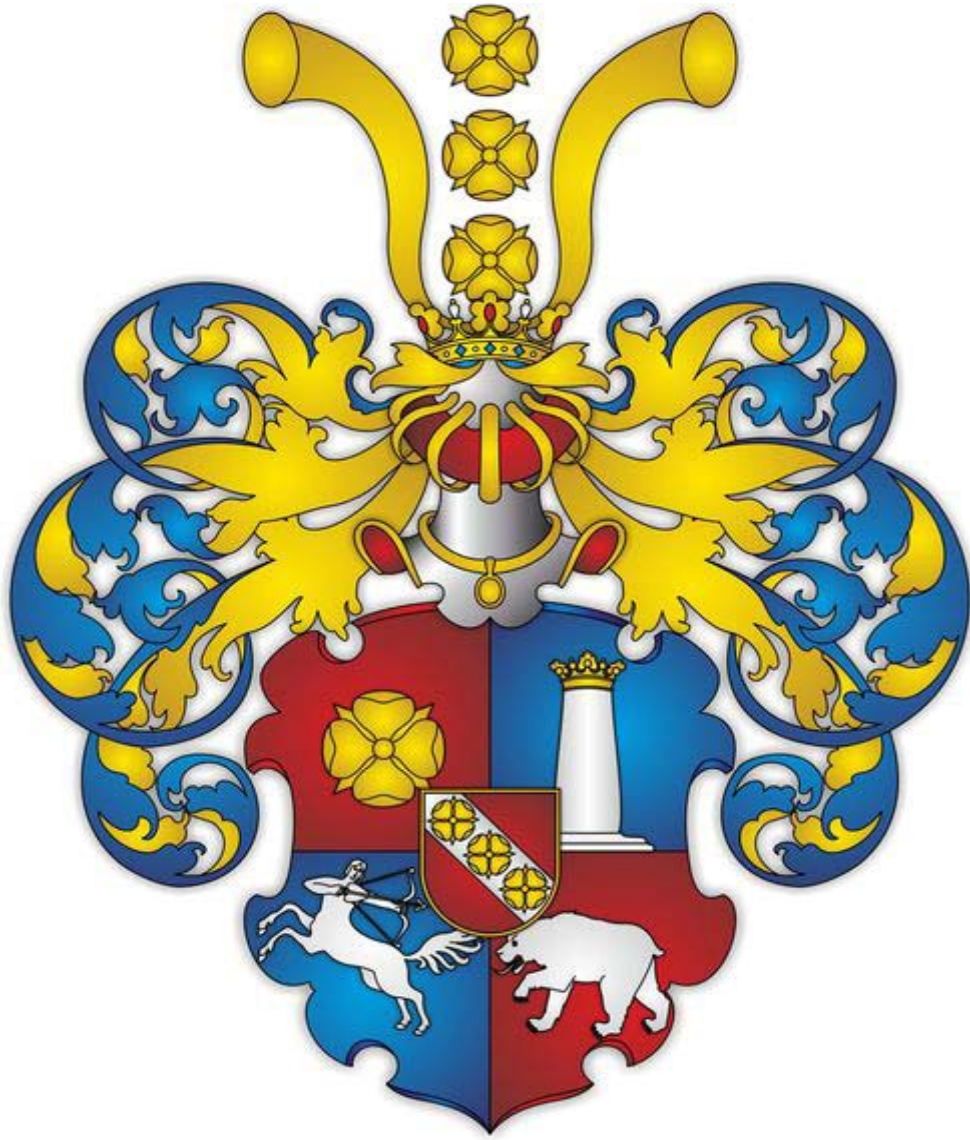
Рис. 1. Герб родини Донець-Захаржевських