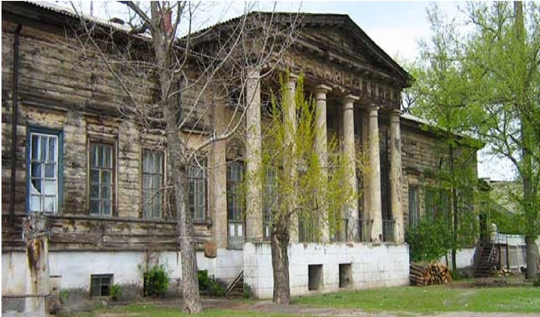
Рис. 10. Сучасний вигляд фасаду садиби Донець-Захаржевських (Задонських)