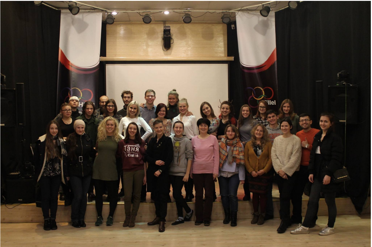
Додаток Є. Фрагменти репетицій свідочької вистави