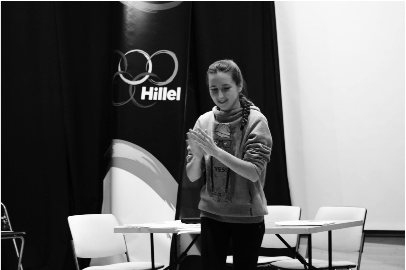
Додаток Е. Фрагменти вистави у Форум-театрі