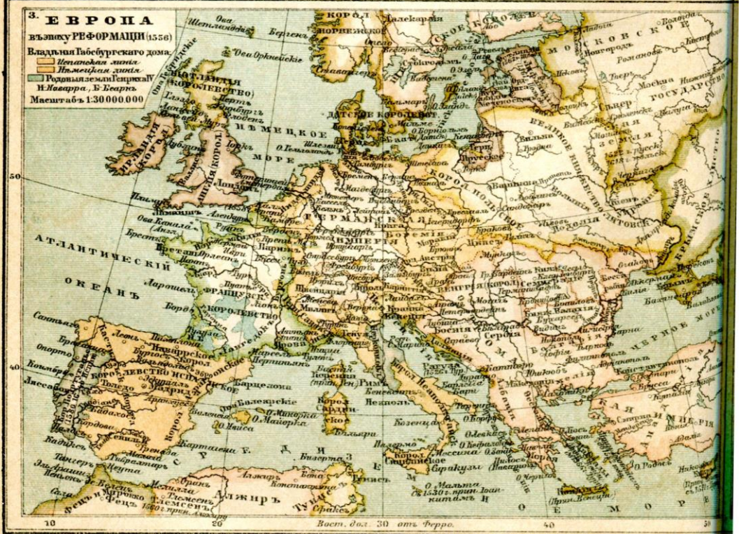
Брокгаузъ и Ефронъ. Энцикл. словарь.