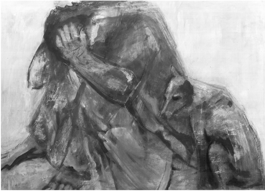
Іл. 5. Застиглий жах. Мішана техніка. 59x85 см. 2015

У кожній роботі циклу своя образна мова, художні засоби, своє філософське трактування, підпорядковане розкриттю головної теми – Чорнобилю.