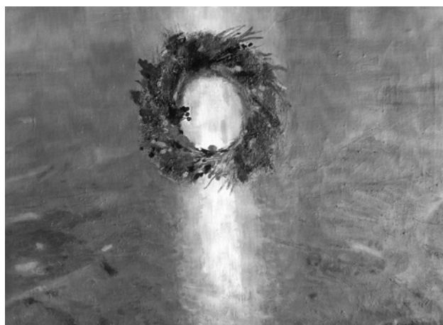
Іл. 4. І впала з неба зоря велика, ім'я – Полін. Полотно, олія. 75x100 см. 2006

Особливе місце у творчості В. Бистрякова відведено Чорнобильській трагедії. Трагічна для України і світу подія викликала до життя цикл картин: «Подруги. Чорнобильяни», «Коли птахи не співають», «Евакуація», «Світлий натюрморт у темній кімнаті», «Плач Єремії», «І третій ангел просурмив», «Соняшники», «Спас», а також серію картин «І впала на землю зоря». У 2016 році був видано каталог «Осянні полиновою зорею», в якому зібрано п'ятдесят художніх творів, присвячених цій тематиці.