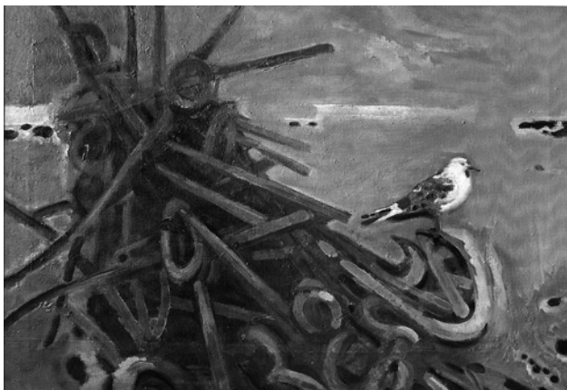
Іл. 2. Пам'ять про чисту воду. Полотно, олія. 74x105 см. 2006

ський 7), також в газеті «Культура і життя» (1975) поряд з роботами видатного художника старшого покоління – народного художника М. Дерегуса.