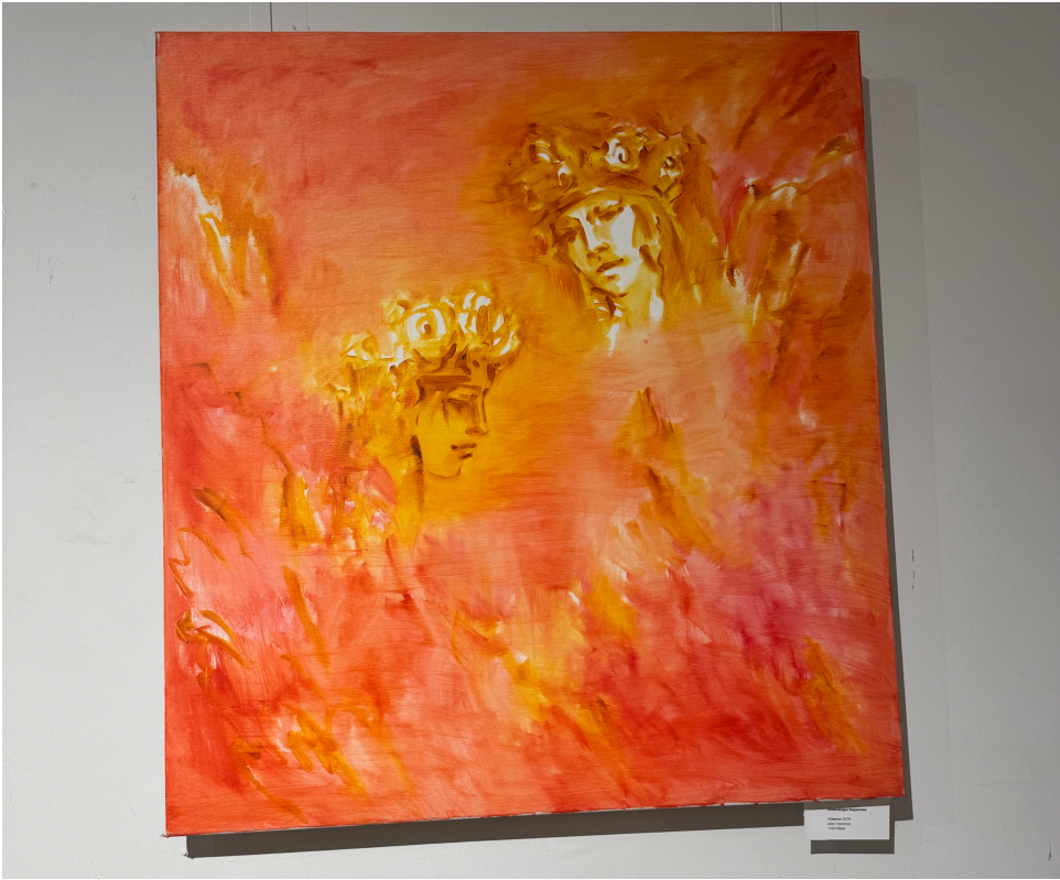
23. Іл. 23. Олександра Кирилова. Свято. Полотно, олія. 2018. З приватної колекції.