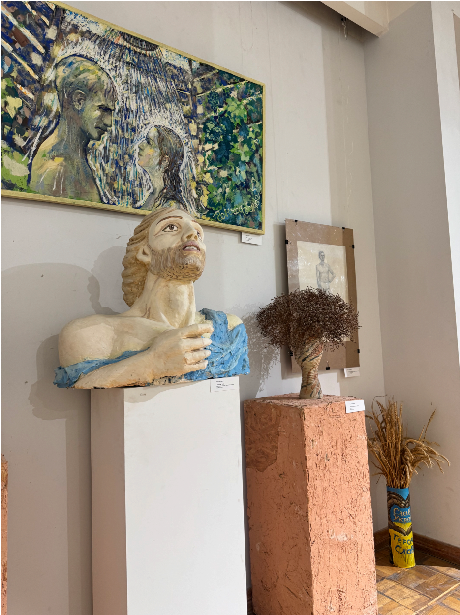
22. Іл 22 Іл. Х. Гончаренко Ігор. Одисея.. Гіпс, темпера. 60 × 50 × 35 см.