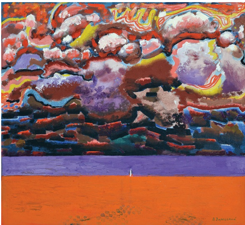
16. Іл. 16. Віктор Зарецький. Реквієм. 1984. Полотно, олія