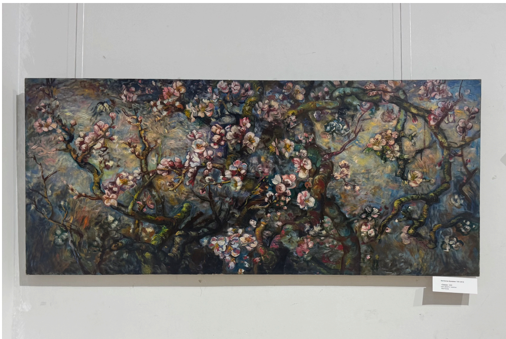
21. Іл 21 Костянтин Кунцевич «Сакура» 2008