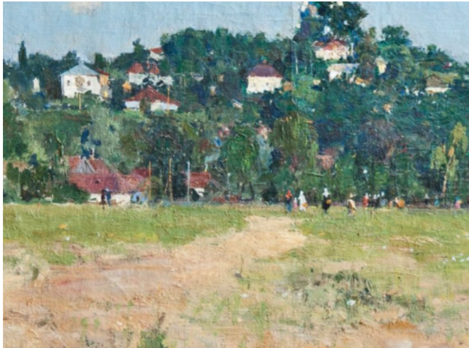
1. Іл 1. Віктор Зарецький. Пейзаж. Канів. Картон, олія. Приблизно 1950–1951. Вступна робота до Київського художнього інституту. З приватної колекції.