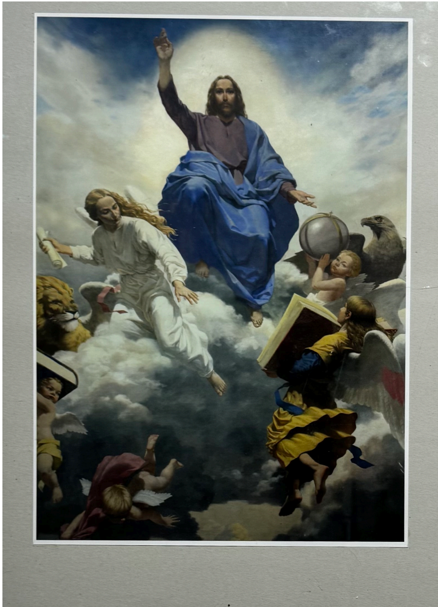
24. Іл 24 Юрій Матвійчук. Фрагмент розпису храму Святого Миколая. Темпера по штукатурці. 2010.