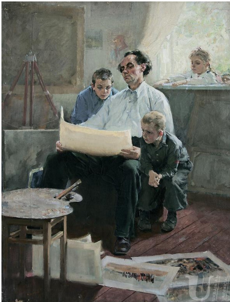
18.Іл. 18. Віктор Зарецький. Батько та діти. 1980-ті. Полотно, олія.