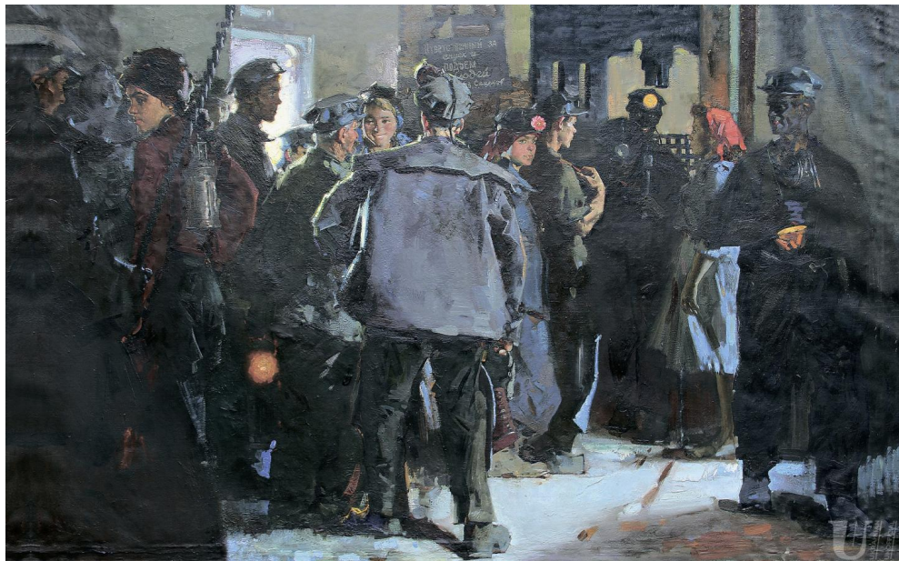
2. Іл. 2. Віктор Зарецький. Шахтарі. Зміна. 1955. Полотно, олія. 142 × 223 см.