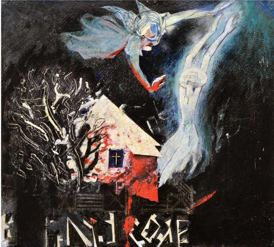
6. Іл. 6. Віктор Зарецький. Душа Алли Горської. 1980-ті. Картон, олія. 46 × 51,5 см. Підпис на звороті.