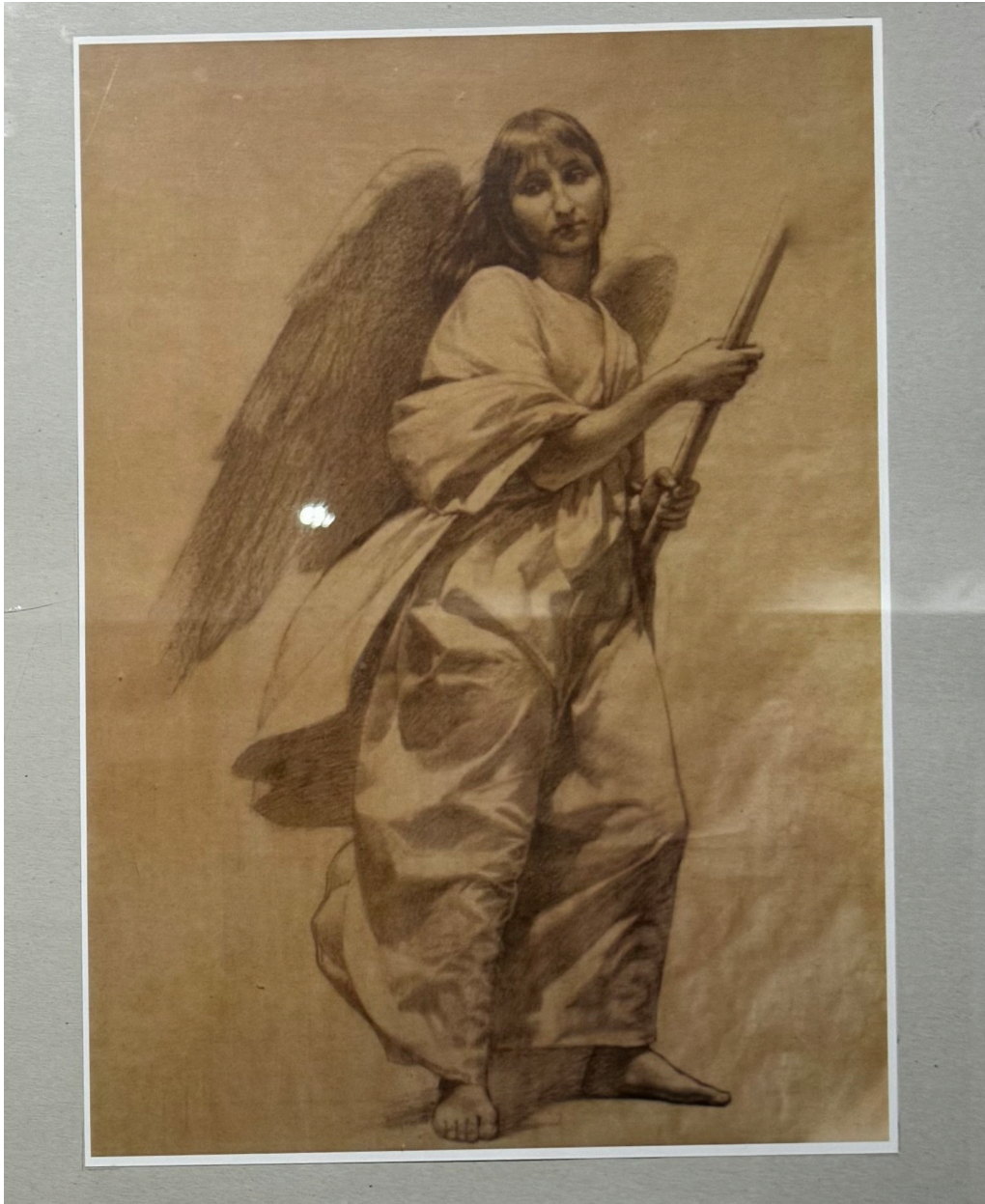
25.Лл 25. Юрій Матвійчук. Фігура натурника. Папір, сепія . 1979. З приватної колекції.