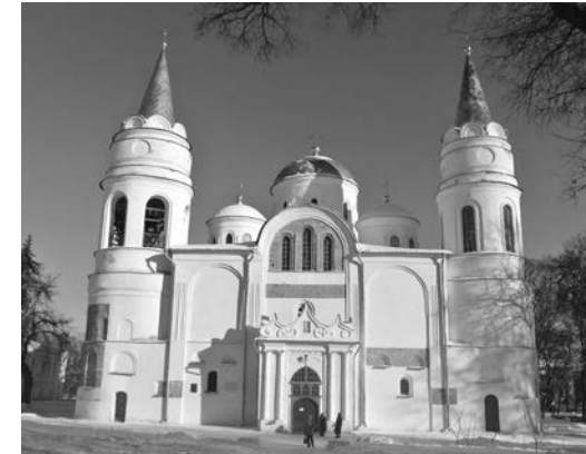
Іл. 1. Спасо-Преображенський собору Чернігові. Сучасний вигляд із західного боку. 2016

Рамена просторового хреста перекриті циліндричними склепіннями з орієнтацією шелиг по осях рамен. Кутові компартименти наоса між раменами просторового хреста увінчані чотирма куполами на барабанах, бічні частини нартекса над хорами перекриті купольними склепіннями. На фасадах