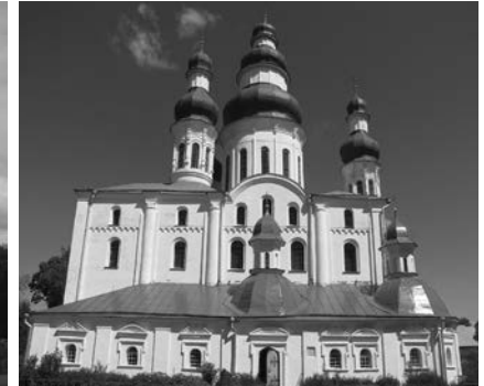
Іл. 3. Успенський собор Єлецького монастиря у Чернігові. Сучасний вигляд з південного боку. 2017