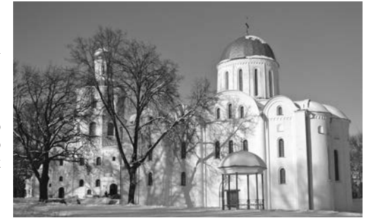
Іл. 4. Борисоглібський собор у Чернігові. Сучасний вигляд з південно-східного боку. 2016

В деяких місцях наявні нижні частини закомар, центри яких розташовані на одному рівні. Окремі закомари зберегли нижні частини вікон (ніш). На кресленні західного фасаду М. Холостенка в центральному пряслі видно залишки нижніх частин трьох вікон у центральній закомарі, а в закомарі північного прясла – одного вікна (або ніші) [7, с. 191, рис. 2].