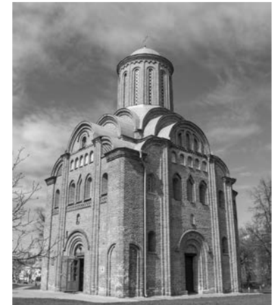
Іл. 6. П'ятницька церква у Чернігові. Сучасний вигляд з південно-західного боку. 2016

П'ятницька церква – літописна дата невідома (іл. 6). За архітектурними формами і будівельною технікою пам'ятка належить до кінця XII – першої третини XIII ст. [2, с. 29–30]. Мурувальна техніка «opus isodos». Простий