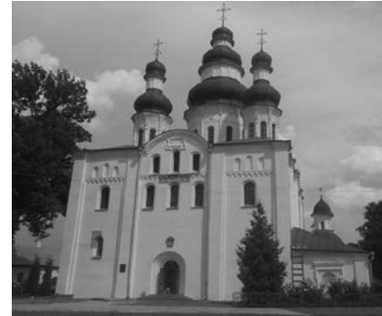
Іл. 2. Успенський собор Єлецького монастиря у Чернігові. Сучасний вигляд із західного боку. 2015