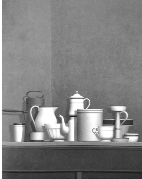
Вільям Бейлі. П'яца Фортебраціо. 1981

Бейлі був зачарований італійською провінцією, її духом і колоритом, які гармонійно співзвучні шедеврам італійського Відродження. Художник писав, що пропорції предметів певною мірою співпадають з тим, що він підсвідомо абсорбував з італійської міської архітектури. Дивлячись на картину, він