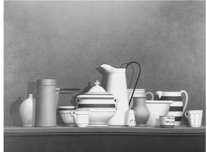
Вільям Бейлі. Натюрморт «Монтеркі». 1981

Повернувшись, молодий художник показав свої роботи професорові Джозефу Альберсу – знаному й авторитетному педагогові, який і взяв його на свій курс. В 1957 році Бейлі отримав ступінь магістра. Художник згадував, що Альберс був першим, хто поставився до його творчих спроб серйозно, і що ідеї метра були актуальні та переконливі. Він міг бачити позитивне у будь-якій роботі, навчав В. Бейлі критично мислити і бути вимогливим до своєї творчості. Альберс підтримував стосунки з Джексоном Поллоком та Віллемом де Кунінгом і був прихильником їхньої виняткової художньої харизми. Мистецька ідеологія й система викладання Єльського університету ґрунтувалася на абсолютній свободі самовираження та давала широкі можливості для творчого пошуку в різних стилях і напрямках. Бейлі наголошував, що завжди був фігуративним художником. Його ранні експерименти в абстрактному живописі