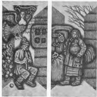
Іл. 3. А. Кривач. Ілюстрація «Стрілець» до «Творів» Ю. Федьковича. Літографія. 1980

Київські художники, які працювали в галузі книжкової графіки, брали активну участь в Республіканських виставках ілюстрації та книжкового оформлення. На III Республіканській виставці «Художник і книга» демонструвалися кольорові літографії Г. Варкача із серії «Рими» (1980), Ю. Шейніса за мотивами творів В. Маяковського (1981), аркуші З. Кружкової за мотивами твору Є. Гребінки «Пригоди синьої асигнації»