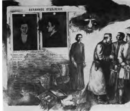
Іл. 1. В. Радько. Ілюстрації до книги М. Горького «Мати». Літографія. 1983

В майстерні станкової графіки (яку очолював професор І. Селіванов, а згодом, після його смерті, з 1985 р. – професор А. Чебикін), – студенти все ще працювали над політично заангажованими ленінськими, революцій-