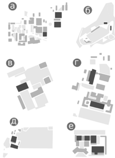
Іл. 5. Зонування українських кіностудій: а – Одеська кіностудія, б – Ялтинська кіностудія, в – Національна кінематика України, г – кіностудія ім. О. Довженка, д – Victoria Film Studios, е – студія Film.ua