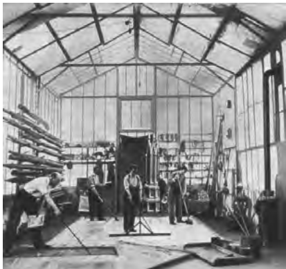
Іл. 1. Студія Жоржа Мельєса в Монтрі. Франція

освітлення. Із розвитком кіновиробництва, появою звукового, а згодом і кольорового кіно, функціональне наповнення кіностудій зростало, і з часом вони перетворювалися на зменшені аналоги міста.