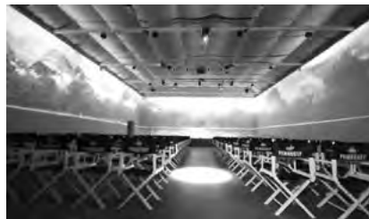
Іл. 2. Павільйон №1 на Одеській кіностудії

На території України перші кіностудії з'явилися відносно рано. Найдавнішими з них є Ялтинська кіностудія, відкрита в 1917 році і націоналізована радянською владою в 1919 році, та Одеська, де було створено такі відомі стрічки, як «Місце зустрічі змінити не можна», «Пригоди Електроніка», «В пошуках капітана Гранта».