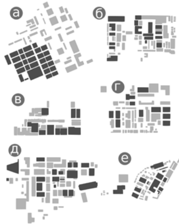
Іл. 3. Зонування закордонних кіностудій: а – Warner Brothers, б – Paramount, в – Sunset Gower Studio, г – 20th Century Fox, д – Pinewood, е – CBS Studio Center

Зелені зони займають від 7% до 40% території студій. Це можуть бути як розосереджені по території сквери, так і повноцінні парки. Так, наприклад, на території студії Ріхаг, заснованій в США у 1986 році, зелена зона займає 30% території і навіть включає амфітеатр.