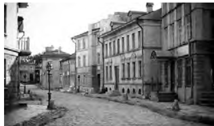
Іл. 4. Вуличні (натурні) декорації. Студія Мосфільм

Окремою зоною деяких кіностудій є вуличні (натурні) декорації (іл. 4). Їх поділяють на три типи: тимчасові (створені під конкретний фільм, а потім розібрані), постійні (архітектурні споруди, моделі міських площ, для знімання різних фільмів) та ланд-