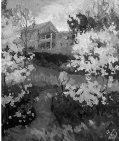
Іл. 2. І. Аношкін - Ларіп. Квітучий сад. 2015

Існує думка, що художникові-пейзажисту не обов'язково вміти гарно рисувати й компоувати, а достатньо мати колористичний дар. Безумовно,