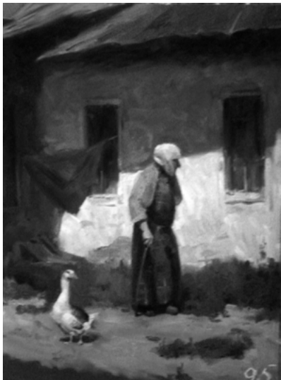
Іл. 1. С. Сидоренко. Старенька біля хати. 2015

У першому семестрі навчання студентам першого курсу пропонується дві теми: «Композиція на вільну тему» і «Пейзаж Києва»; у другому – виконання трьох завдань: «Пейзаж Києва», «Київ і кияни», «Композиція на історичну тему».