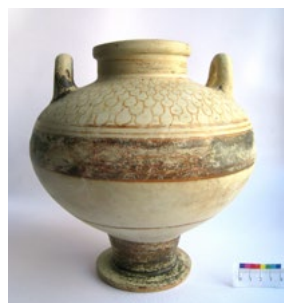
Лл. 1. Піксида (друга половина VI ст. до н.е.) з колекції Археологічного музею ІА НАН України: а – до реставрації; б – після реставрації