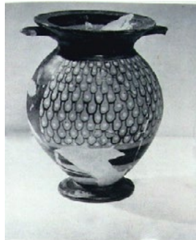
Лл. 3. Клазоменська амфора іонійської кераміки некрополя Ольвії (кінець VI ст. до н. е.), знайдена в 1909 р. у дитячій могилі

Досліджувана піксида має такі розміри: висота