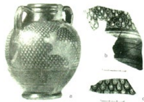
Лл. 2. Клазоменська амфора (кінець VI ст. до н.е.), знайдена на Керченському півострові у поселенні Тіртаки у 70-ті роки XIX ст. (а) та фрагменти амфор з лускоподібним орнаментом (б, в)

Монографія В. М. Скуднової є першою повною публікацією, в якій надано найціннішу інформацію про вигляд давнього міста Ольвії і, що особливо важливо, про його різноманітні контакти в ранній період існування поселення. Тут також знаходимо аналоги клазоменській