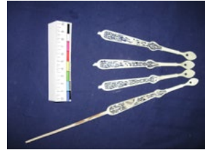
Лл. 3. Кісточки віяла, виконані з епоксидної смоли

Після демонтажу виявилось, що зворотний бік екрана віяла забруднений, на місцях кріплення крайніх кісточок наявні залишки клею бурого кольору,