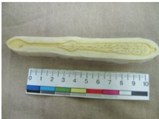
Іл. 2. Форма для відливки з силікону