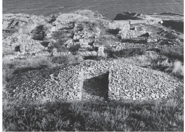
Іл. 5. В. Бахтов. Купол. Проект реконструкції. 1995. Фрагменти античної кераміки. 1,2x1,4x1,4 м. Ольвія, Нижнє місто. (Мистецтво 28)

шафту як культурної та національної цінності (іл. 5, 6). Освоєння середовища художниками демонструє взаємозв'язок історичних і ландшафтних структур, окреслюючи вернакулярну складову вітчизняного лендарту та виокремлює його регіональну ідентичність.