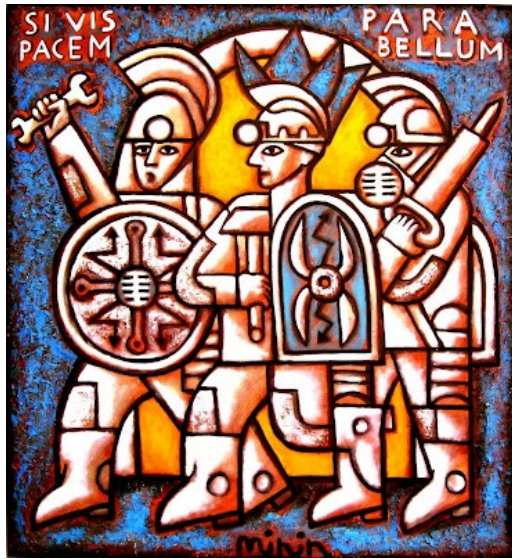
Лл. 2. Р. Мінін. Si vis pacem, para bellum. 100x90 см. Полотно, акрил. 2007–2011 [http://minerfolk.blogspot.com/]

які в ранній збірці виступали окремими творами, – «Хочеш миру – готуйся до війни», «На гора», «Врубайся» (іл. 2).