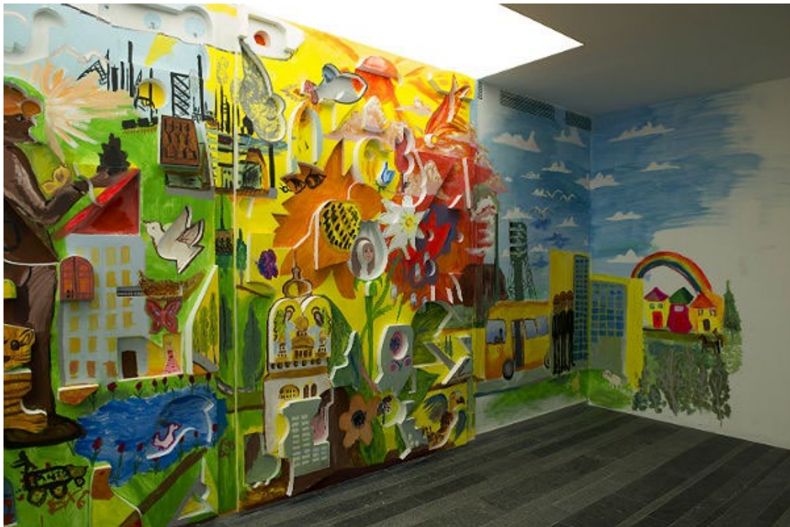
Лл. 3. Р. Мінін. План втечі з Донецького регіону. Проєкт «Пінчук Арт Центру». Фото С. Ілліна. [https://pinchukartcentre.org/ru/photo_and_video/photo/24054]

Твір супроводжується криптограмами: «ПЕРЕСТУПИ ПОРОК СВОИХ ОТЦОВ УВИДИШЬ МИР ДОНЕЦКИХ БЕГЛЕЦОВ», «В ШАХТУ ЛЕЗТЬ ИЛИ В ТЮРЬМУ ЖИТЬ ПО ДУШЕ ИЛИ УМУ» (рос.). Тексти справляють неоднозначне враження, їхній тривожний зміст натякає на приреченість і безпросвітне майбутнє соціуму, у якому недоля володарює над людиною. Автор з відвертістю описує стан справ того часу у своєму інтерв'ю А. Соколовій: «Кримінальна романтика прижилася у цьому регіоні більше, ніж у інших (...) «Йти до успіху» – значить йти в шахту. Шахтарями ставали ті, хто не хотів нікого кривдити. За це я дуже люблю їх. Ті, хто був «більш пробивним», йшли у кримінальне середовище. Звичайно, хотілося із цього середовища виїхати тим, хто не хотів ні першого, ні другого» [10].