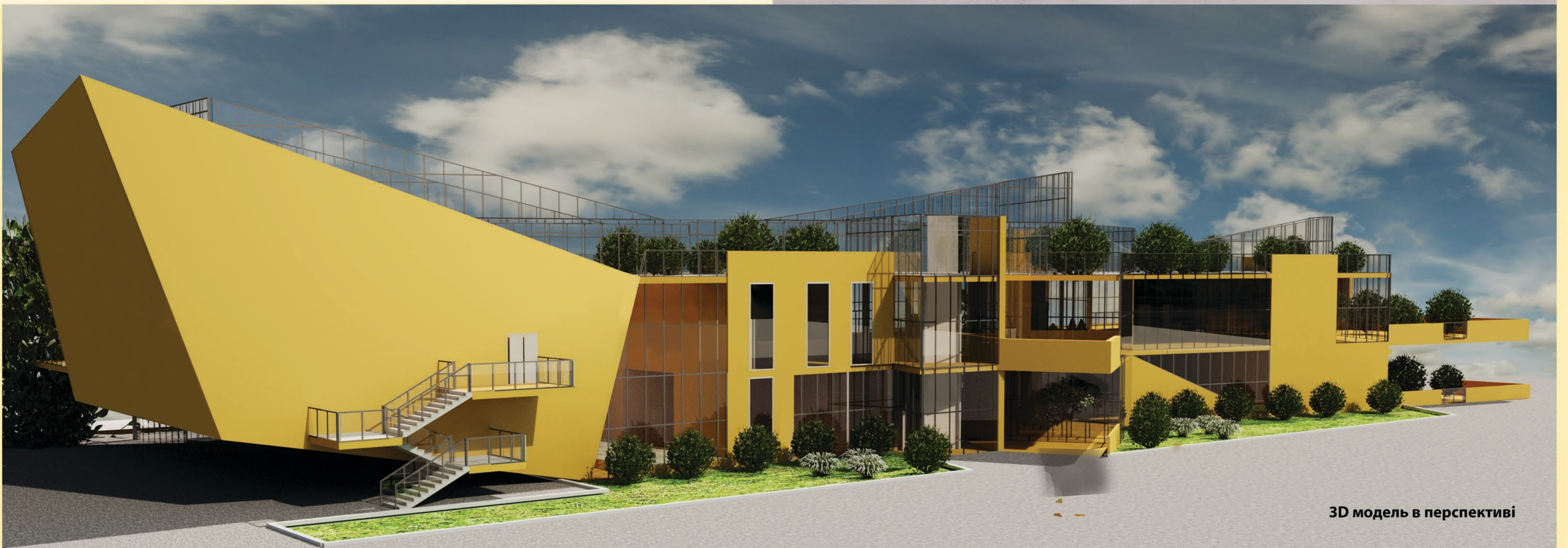
3D модель в перспективі