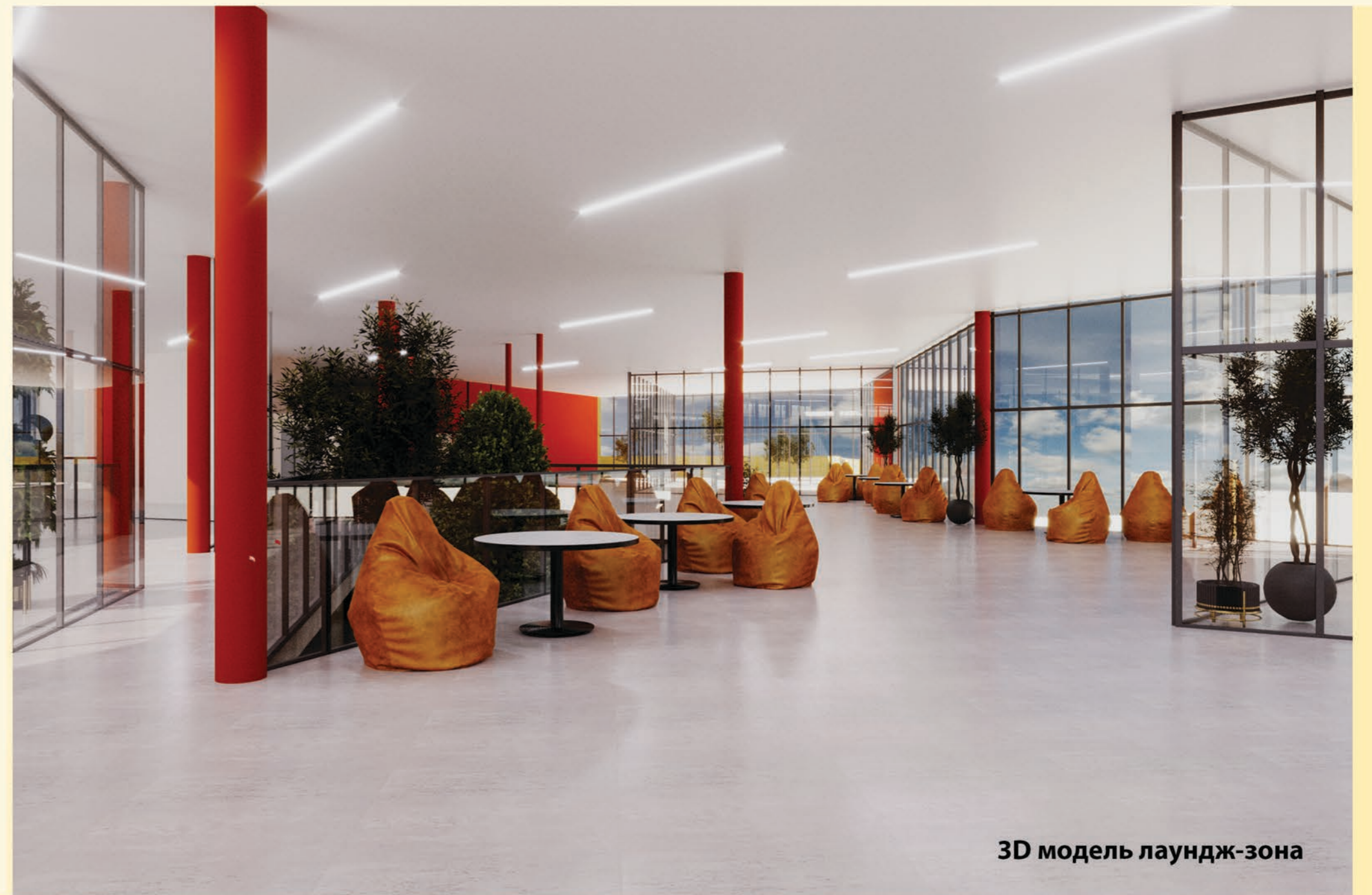
3D модель лаундж-зона