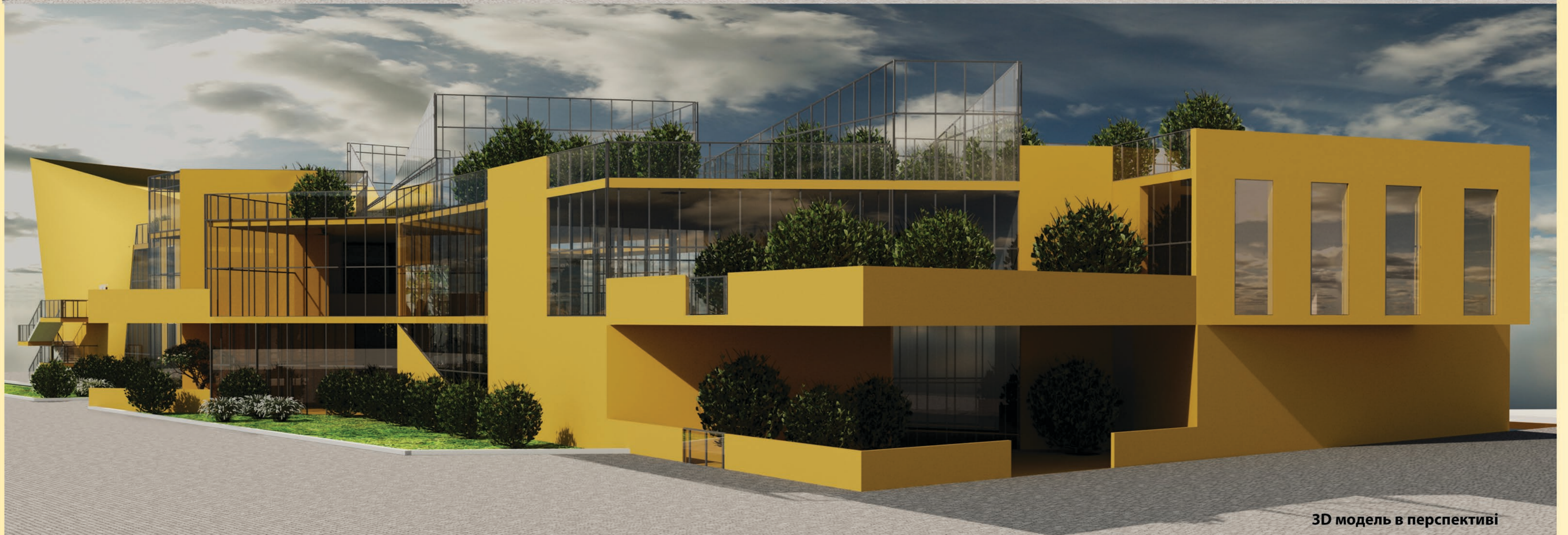
3D модель в перспективі

Виконала студентка 4 курсу архітектурного факультету НАОМА Пінчук Вероніка Керівник - Скорик Лариса Павлівна