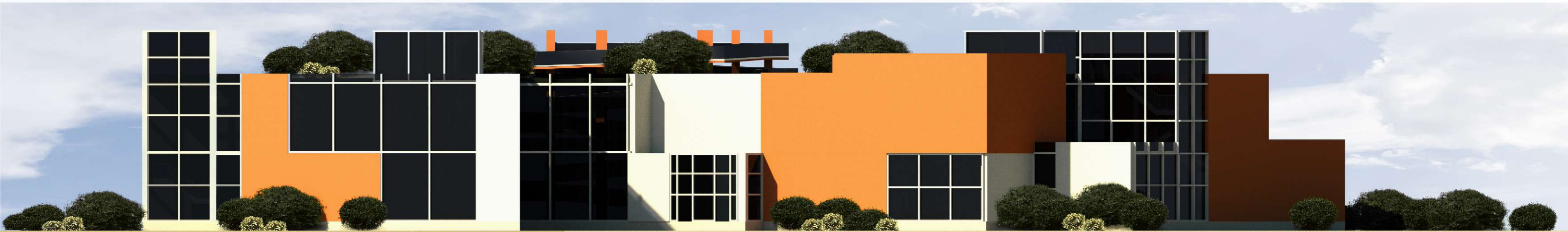
головний фасад 1:200