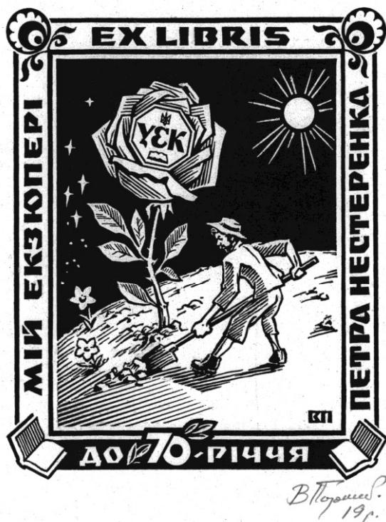
Рис. 5. Порічанський В. Екслібрис Петра Нестеренка. Туш, перо. 2019 р.