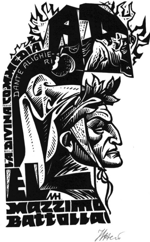
Рис. 2. Неймеш М. Екслібрис Маззімо Баттолла. Лінорит. 2001 р.

струнку постать Беатріче, створену білими лініями на чорному нічному тлі, яке доповнює яскрава біла зірка. Екслібрис Володимира Вишняка з Київщини, адресований Массімо Баттоллі, виконаний у техніці гравюри на пластику, яка дозволила художнику створити ліричну графічну новелу, в основі якої на передньому плані зображені постаті Данте з квіткою в руках і Беатріче. За ними, на другому плані, на тлі нічного неба жіночі постаті, які крокують із запаленими свічами в руках.