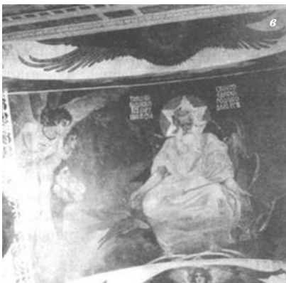
Іл. 2. Розпис «Бог Отець»:

а — до реставрації; б — картон для реставрації групи янголів у композиції (папір, вугіль, 1995); в — після реставрації (олійні фарби по штукатурці, 1995, реконструкція М. В о в ч о к)