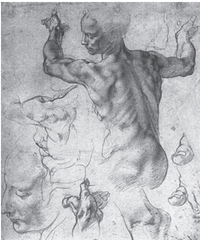
Іл. 4. Мікеланджело. Етюд до постаті «Лівійської сивілі». Папір, сангіна. 1511

Пізніше рисунки Мікеланджело стають масштабнішими й вільнішими. Під впливом Леонардо да Вінчі, який започаткував у творчості рисувальників сангіну, Мікеланджело, водночас із пером, починає працювати з цим матеріалом, проте повністю ігнорує його живописні можливості – штрих сангіни. У Мікеланджело – чіткий, величавий і сильний, він ще більше підсилює пластичність та всеосяжну об'ємність відображуваних форм. Так виконані, зокрема, деякі підготовчі етюд для Сікстинського плафону