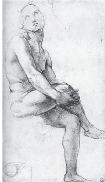
Іл. 2. Рафаяль. Етюд до Адама. Папір, сангіна. 1509

У ході розвитку історії мистецтва з різноманітних типів рисунка виділяються три основних: площинно-графічний, об'ємний і живописний. Виходячи з цього, мистецтво Ренесансу можна розглядати як поступовий перехід від площинно-графічного формосприйняття, яке відповідало абстрактно-спіритуалістичному мисленню середньовіччя, до