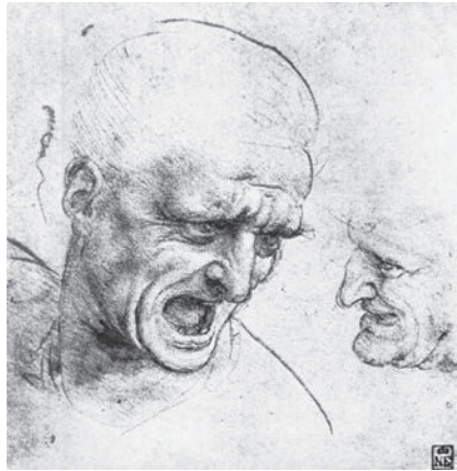
Іл. 3. Леонардо да Вінчі. Рисунок двох солдатів для розпису «Битва при Ангіарі». Папір, італ. олівець, сангіна

Але, як зауважував ще Вазарі, до Мікеланджело ніхто ніколи не рисував подібним чином. Короткі, густо покладені перші штрихи, в тінях перехрещуються між собою, врізаються в форму, чітко й точно її моделюючи, подібно до різця скульптора, який обробляє брилу граніту; фактурне трактування оголених тіл і одягу однакове, енергійні контури важко й напружено охоплюють тіла людей, ніби художникові при їхньому нанесенні доводилось перемагати фізичний спротив матеріалу. Вільно переробляючи оригінали, з яких виконував копії Мікеланджело в дусі початкового Високого