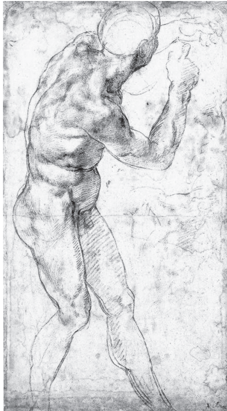
Іл. 5. Мікеланджело. Ескіз до картону «Битва при Кашині». Папір, сангіна. 1504

“Битва при Кашині” привернула увагу всіх італійських художників того часу, нею захоплювались Джорджо Вазарі і Бенвенуто Челліні. Ос-