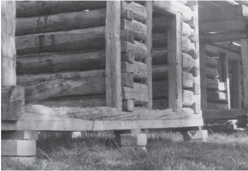
Реставація кутового замка вінця стіни

режами) і як магніт притягують потенційних «інвесторів» для різного роду будівництва (дач, готелів, розважальних закладів, автозаправних комплексів тощо). Часто подібне будівництво починається без обов'язкового оформлення дозвільної документації за принципом: «коли побудуємо, ніхто не знесе, а пізніше, пройде час і можна узаконити землю та побудовані будівлі», а інколи на таку забудову недалекоглядними чиновниками