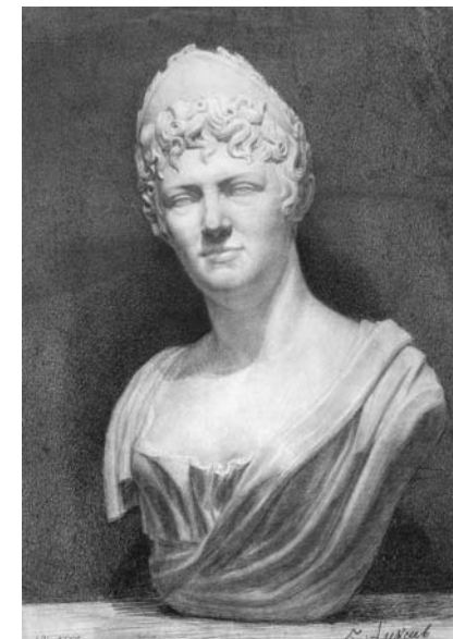
Іл. 2. Алексеев. 1952