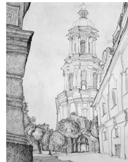
Іл. 4. Павлишин. 2003