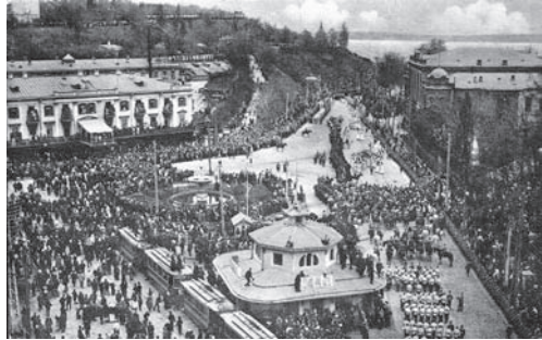
Іл. 6. Парад на Царській площі

Ще однією спробою залучити додаткову кількість відвідувачів стало будівництво бічного крила, яке виходило на дорогу до пам'ятника Св. Володимиру та вулицю Олександрівську. Цю добудову розпочав