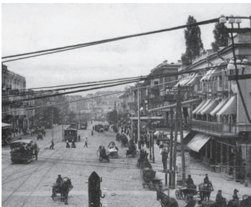
Іл. 5. Закриті маркізи на вікнах готелю

Варто зауважити, що подібна зміна зовнішнього виду виявилася також дуже вірним іміджевим вирішенням. Розташований на одній з головних площ міста, готель почав слугувати зручною глядацькою трибуною. Під час військових парадів та інших велелюдних заходів саме на балконах готелю “Європейський” збиралася вишукана публіка для пере-