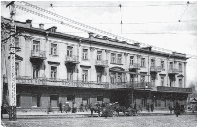
Іл. 7. Фасад готелю “Європейський” з 90-х років XIX ст. до 20-х років XX ст.