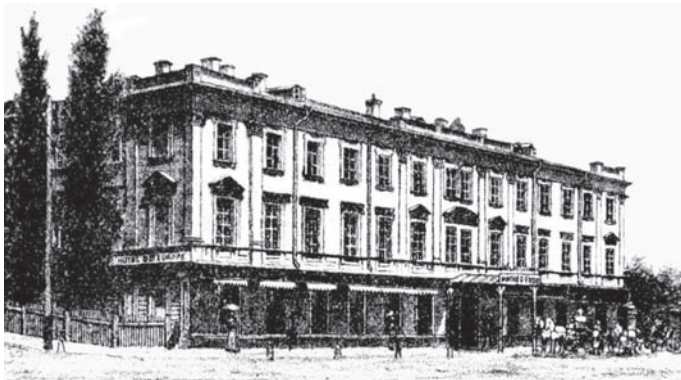
Іл. 1. Готель “Європейський”. Арх. О. Беретті. 1858

Якщо на 1824 рік у Києві офіційно було лише 2 готелі, у 1866 році — до 30, то наприкінці XIX ст. їх вже налічувалося понад 100.