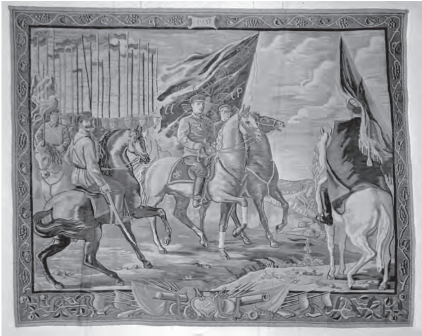
Д. Шавикін. Гобелен “Парад червоного козацтва”. 1936

Після встановлення радянської влади в Російській імперії, до якої належала й Україна, розпочався новий етап розвитку в історії уже радянського українського народного мистецтва і зокрема килимарства, осередки виробництва якого через зазначені причини припинили своє