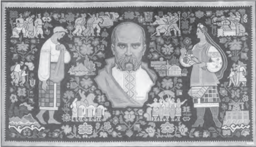
І. та М. Литовченко. Гобелен “Т. Г. Шевченко”. 1961

ж виникла велика художньо-промислова артіль у Полтаві, до назви якої наступного року додалося — “імені Лесі Українки”. Вона об’єднала багатьох майстрів килимарського промислу таких відомих осередків, як Диканька, Великі Будища, Зіньків, які в 30-х роках перетворилися на самостійні художньо-промислові підприємства.