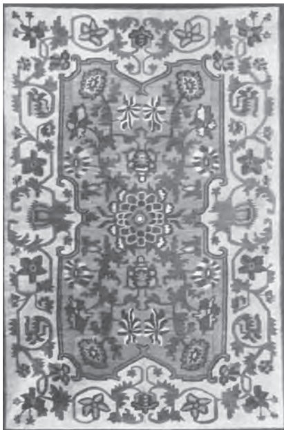
Орнаментальний килим. Артіль “Червоний килим” (с. Добровеличківка Кіровоградської обл.). 30-ті роки

У тому ж 1922 році почала працювати Миргородська ткацька майстерня з роздавально-замовним пунктом у селі Олефірівці. Вже упродовж першого року функціонування майстерні було залучено до творчої праці близько 200 майстрів-надомників, у тому числі й килимарів, з навколишніх сіл. Тоді