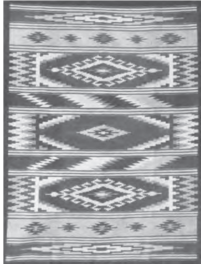
С. П о в ш у к . Килим “Гуцул” (м. Косів Швано-Франківської обл.). 1968

Підсумовуючи викладене, можемо констатувати: українське килимарство упродовж ХХ століття, певною мірою видозмінюючись, пройшло етапи непростого, але в цілому переможного поступу і являє собою важливий компонент національної художньої культури.