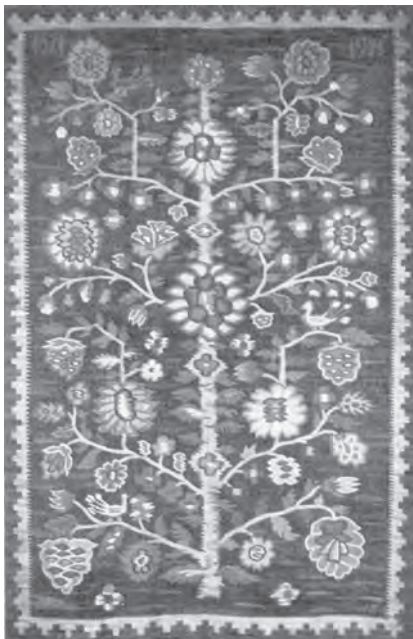
Л. Товстуха. Килим “Лісова пісня”. 1970

Інтенсивного розвитку український тематичний килим набуває з середини 30-х років. 1935 року в Києві при Музеї українського мистецтва (нині Національний художній музей України) були організовані Експериментальні майстерні для виготовлення експонатів до запланованої на 1936 рік масштабної