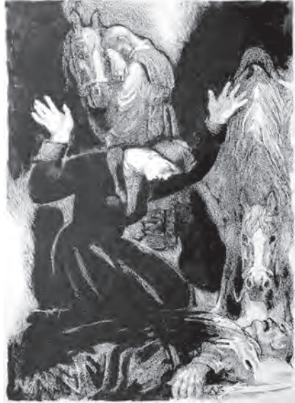
М. Компанець. За мотивами повісті М. Гоголя “Страшна помста”. Папір, туш, перо. 2008–2009

Що б не зображував художник — образна конкретика завжди позначена високою графічною культурою, “вивірена математикою”. Але інтуїтивне, чуттєве начало у творчості нашого автора численних книжкових ілюстрацій та виставкових рисунків і акварелей домінує над раціональним. І ніякими композиційно-режисерськими мудруваннями не досягнути того, що може створитися тільки через душу талановитого митця. А непосвяченим в таїну його творчої “кухні” може здатися, ніби вийшло це у нього випадково. Художник Компанець на такі “випадковості” є одним з найшасливіших серед колег-сучасників. У його мистецтві все переконаливе і ясне, бо все пережите, відчуте і виношене роками. Зазвичай, працюючи над темою, художник так вживається у світ героїв