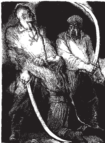
М. Компанець. За мотивами повісті М. Гоголя “Страшна помста”. Папір, туш, перо. 2008–2009

Десятки всеукраїнських, колишніх всесоюзних, міжнародних та групових художніх виставок презентували шанувальникам української графіки твори члена Національної спілки художників України (від 1970) Миколи Компанця. Крім книжкової графіки, глядачів полонили сердечною ширістю, вишуканою простотою і оригінальною майстерністю аркуші вільної графіки із серії рисунків за мотивами творів М. Стельмаха (кінець 1970-х), серій “Закарпатські мотиви” (1990), “Симеїз” (1996), “Ритми Карпат” (2002–2004). Та особливе місце в творчості за душевністю і мистецькою глибиною належить серії “Земля батьків моїх”, яку з початку 1980-х митець продовжує попов-