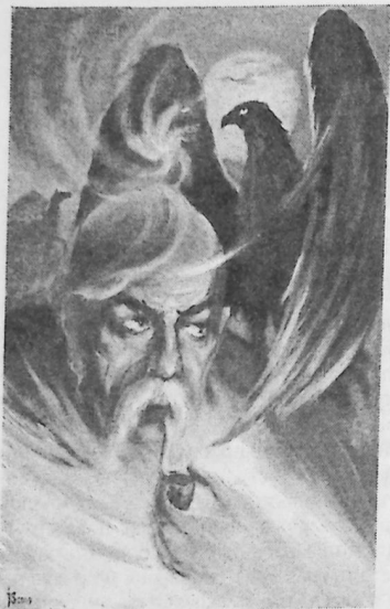
В. Крижанівський. Характерник. 2004

проти годинникової стрілки, уособлюючи ліву сваргу. Кожна брила споруди вказувала сторону світу, яка містила певний настрій, який людині відкривав доступ до Сили тієї чи іншої пануючої стихії.