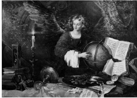
Іл. 3. Час. Полотно, олія. 65x90. 2001

Вартим особливої уваги є твір під назвою «Час» (іл. 3), характерним для якого є алегорична сутність задуму. Композиційний центр картини – це постать ангела, що нагадує про буденність земного життя та розкриває сутність мирського буття людини, плинність часу... На першому плані композиції розташовані предмети, які уособлюють символічні поняття життєвих пристрастей людини. Автор застосовує принципи кулісної композиції: з одного боку зображує червону завісу, яка відокремлює матеріальний світ предметів та спокус від духовного та нематеріального всесвіту. Палаюча свічка – символ життя в часовому проміжку, яке іде своєю чергою. Таким є творчий пошук та філософські роздуми художника про життя, про його швидкоплинність, про вічні людські цінності та моральні устої, про чаруючий світ мистецтва.