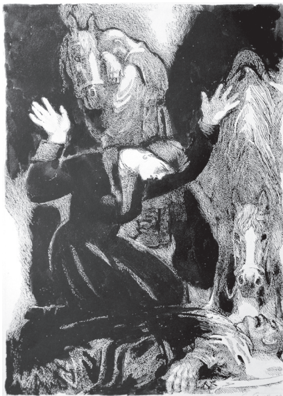
М. Компанець. За мотивами повісті М. Гоголя “Страшна помста”. Папір, туш, перо. 2008–2009

Що б не зображував художник — образна конкретика завжди позначена високою графічною культурою, “вивірена математикою”. Але інтуїтивне, чуттєве начало у творчості нашого автора численних книжкових ілюстрацій та виставкових рисунків і акварелей домінує над раціональним. І ніякими композиційно-режисерськими мудруваннями не досягнути того, що може створитися тільки через душу талановитого митця. А непосвяченим в таїну його творчої “кухні” може здатися, ніби вийшло це у нього випадково. Художник Компанець на такі “випадковості” є одним з найшасливіших серед колег-сучасників. У його мистецтві все переконаливе і ясне, бо все пережите, відчуте і виношене роками. Зазвичай, працюючи над темою, художник так вживається у світ героїв