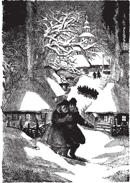
М. Компанець. За мотивами повісті М. Гоголя “Ніч перед Різдвом”. Папір, туш, перо. 2008–2009

Спонукою до творчості є не видання та гонорари, а відчуття спорідненості душ і морально-етичних засад представників різних поколінь. Працював, та й працює, що називається — “до шухляди”. Але завдяки тому, що ювілей письменника спричинив оприлюднення ілюстрацій митця на численних, приурочених до дати, виставках, ми побачили, як мало знаємо Миколу Компанця, без графічного супроводу якого, як своєрідного сучасного співавтора письменника-класика, відтепер гоголівські видання, українські принаймні, годі уваяти. Художник примушує читача-глядача відкривати для себе Гоголя заново, як відкривав його сам. І коли в ілюстраціях до “Наталки Полтавки” І. Котляревського крізь прозоре павутиння штрихів (хитросплетіння сітей навколо героїні і патину часу) до нас проглядають дещо ідилічні образи театрального дійства, де