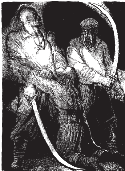
М. Компанець. За мотивами повісті М. Гоголя “Страшна помста”. Папір, туш, перо. 2008–2009

Десятки всеукраїнських, колишніх всесоюзних, міжнародних та групових художніх виставок презентували шанувальникам української графіки твори члена Національної спілки художників України (від 1970) Миколи Компанця. Крім книжкової графіки, глядачів полонили сердечною ширістю, вишуканою простотою і оригінальною майстерністю аркуші вільної графіки із серії рисунків за мотивами творів М. Стельмаха (кінець 1970-х), серій “Закарпатські мотиви” (1990), “Симеїз” (1996), “Ритми Карпат” (2002–2004). Та особливе місце в творчості за душевністю і мистецькою глибиною належить серії “Земля батьків моїх”, яку з початку 1980-х митець продовжує попов-