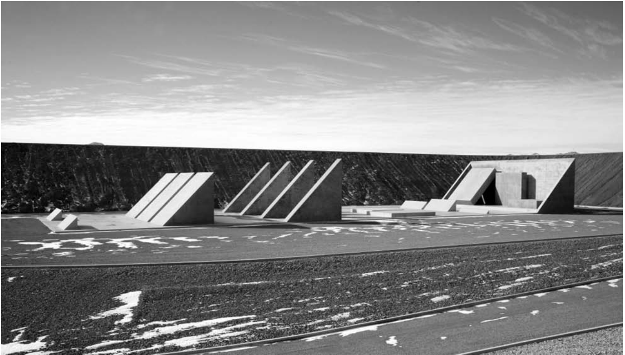
Іл. 1. Майкл Гейзер. 45°, 90°, 180°, Місто. Земля, бетон, сталь. 1972–1974. США, Невада.

фіці обраних матеріалів і тематичній відмінності творів, оскільки у енвіронменті мистці використовують речі, створені людьми, тоді як в лендарті задіяні явища природи. В обох випадках застосовано привласнення готових речей (реді-мейд) як спосіб творення, що вперше було використано М. Дюшаном. Подібний підхід простежується і в лендарті. Тому автор зазначає, що історично лендарт розвивався паралельно з енвіронментом, а об'єднує ці два види сучасного мистецтва на початку їхнього створення інсталяція та зміна контексту. Г. Вишеславський пропонує такі типи творів українського лендарту, як: неоритуальний, соціальний, цитатний. На думку дослідника, вітчизняний лендарт варто позначати терміном «жанро-техніка», оскільки художник в процесі творення емоційно та семантично насичує навколишній простір (Вишеславський, Ленд-арт 61). Автор зауважив, що термін є неприйнятним для класичного мистецтва, тому його доречно вживати, коли йдеться про твори «гібридних» часів та міждисциплінарних досліджень (Вишеславський, Ленд-арт 61). Подібне тлумачення досить суб'єктивне, складне в розумінні та використанні, адже український лендарт досі послу-