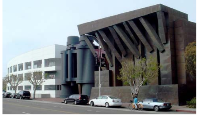
Іл. 3. «Будинок-бінокль». Лос-Анжелес, США. (Арх. Ф. Гері). 1991. [13]

Яскравим зразком постмодернізму є також оригінальна архітектурна споруда «Будинок-бінокль» (Binoculars building, Лос-Анжелес, США) (іл. 3), авторства Ф. Гері (Frank Gehry) – канадсько-американського архітектора, відомого апологета постмодернізму і деконструктивізму