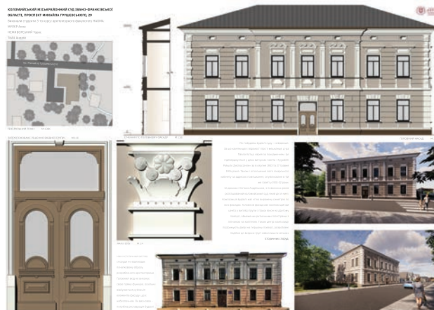
Іл. 1. Житлово-торговий будинок (кінець XIX – початок XX ст.) у м. Коломиї, просп. М. Грушевського, 29. Обмірно-проєктні матеріали практики (виконавці: А. Мулер, А. Ткач, Т. Нежиборський; куратори: Г. Олійник, О. Пашник). 2023 р. [1; 8]

Здобувачам вищої освіти другого (магістерського) рівня (1 курс) запропонували розробити варіанти проєкту реновації мансардних приміщень міської ратуші. Коломийська ратуша є пам'яткою історії та архітектури. Споруджена 1877 року в неоренесансному стилі. Біля підніжжя ратуші влаштовували військові паради,