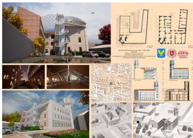
Іл. 4. Проєкт реновації ратуші у м. Коломиї (виконавець Р. Петльований; куратори: Г. Олійник, О. Пашник). 2023 р. [4; 8]

коломийської забудови представили на звітній презентації [8].