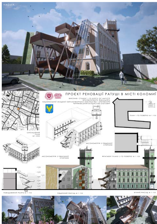
Іл. 3. Проєкт реновації ратуші у м. Коломиї (виконавець В. Черняхівський; куратори: Г. Олійник, О. Пашник). 2023 р. [3; 8]

Формою дозвілля для студентів під час літньої практики був пленер. Двадцять замальовок історичних будівель, деталей та декору