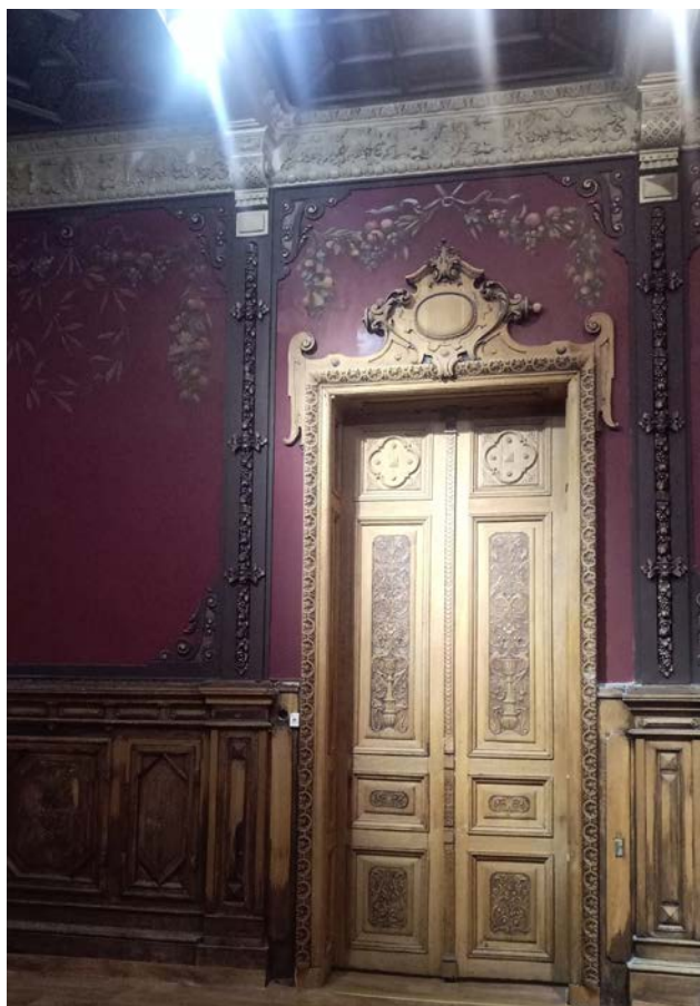
Іл. 7. Інтер'єри Мистецького центру «Шоколадний будинок». Їдальня / Гранатова зала. [Світлина автора 2024 р.]

У процесі нинішньої реставрації, яку проводять автори статті, в Гранатовій залі (їдальні) було виявлено нашарування декількох художніх реконструкцій минулих років – стіни гранатового кольору й зображення фруктових гірлянд. Оскільки стіни тоновані по всій площині в один колір гранатового відтінку та за своєю живописною композицією мають лише орнаменти на верхній частині, цінні збережені елементи були віднайдені минулими реставраторами саме на верхніх орнаментах із зображенням фруктів. Наразі можна помітити крихітні збережені ділянки, які оточені реставраційними тонуваннями та реконструкцією зображення. Живописні відновлення цих орнаментів налічують не менше двох, у деяких місцях трьох шарів реставраційних тонувань, виконаних у різні роки. Отже, з'явилася можливість проаналізувати збереженість первинних розписів і водночас більш пізніх реконструйованих елементів зображень. Також став у пригоді аналіз історичних фотографій та їх порівняння