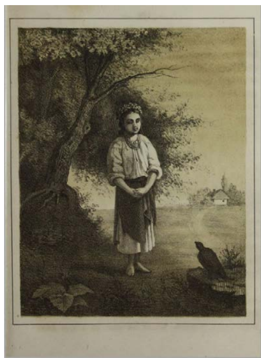
Іл. 3. М. Мурашко. Ілюстрація до казки «Снігова краля». 1873. [10]