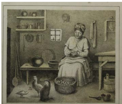
Іл. 2. М. Мурашко. Ілюстрація до казки «Погане вутятко». 1873. [10]