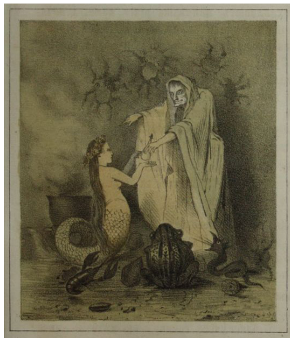
Іл. 5. М. Мурашко. Ілюстрація до казки «Русалонька». 1873. [10]