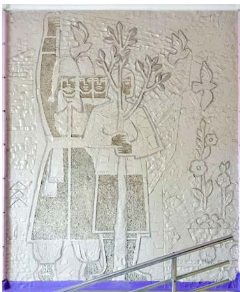
Іл. 2. Сервін В. «Вся влада радам!». Мозаїка. 1960-ті роки. (Ліцей № 3, Івано-Франківськ. Стан до початку втручання 2022 р., з нашаруваннями 1991 р.)