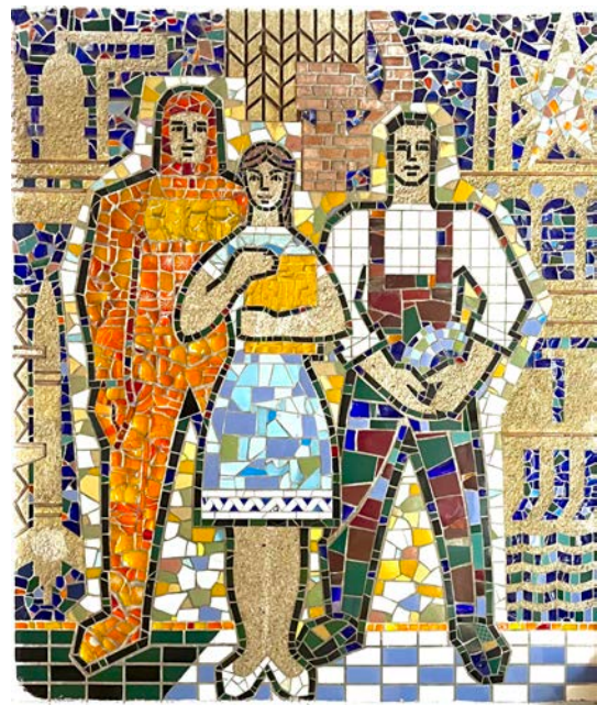
Іл. 3. Сервін В. «Назва невідома». Мозаїка. 1960-ті роки. (Ліцей № 3, Івано-Франківськ. Стан після реставрації 2023–2024 рр.). [Світлина М. Яворського. 2023]