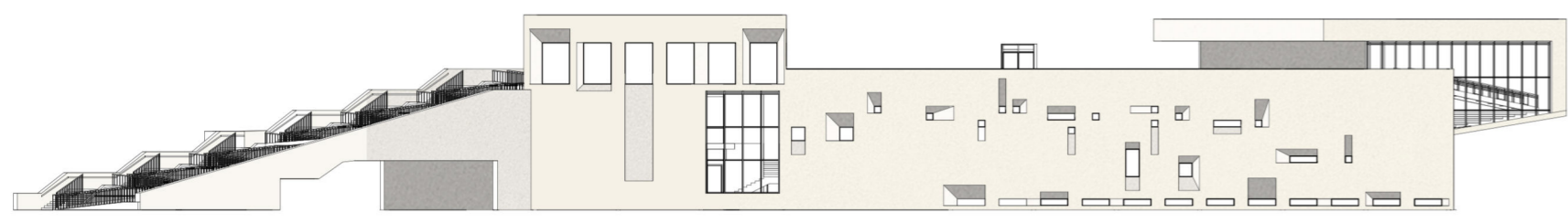
ЗАХІДНИЙ ФАСАД М 1:500

Ділянка має зручне сполучення з пішохідною та транспортною мережами міста. Поруч розташовані зупинки громадського транспорту, облаштовані велодоріжки. З північного боку ділянки запроєктовано майданчик для стоянки службового транспорту музею, також поруч розташовані в'їзди та виїзди з підземної стоянки для автомобілів відвідувачів. На території музею облаштовано озеленені зони зі штучними водоймами, де у спекотну пору року зберігається прохолода.