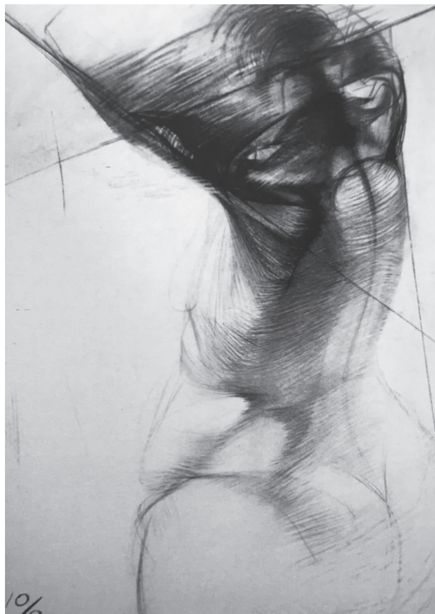
Іл. 2. Ю. Смольський. Академічне завдання. Папір, вуглиня. 80×60 см. 1999 (Максименко, Рисунок )

Чимало ідей П. Чистякова були покладені в основу радянської школи образотворчого мистецтва, водночас йому приклеїли ярлик «стихийного» матеріаліста. Методи натурного рисування знайшли своє відображення в ідеях соцреалізму й були доведені до абсолюту. Були припинені спроби академічної спільноти створити альтернативу офіційному методіві (хоча б теоретично). Так, яскравим прикладом є відома монографія професора М. Радлова «Рисування з натури», котра хоча й була надрукована, однак сприймалася вороже у середовищі критиків. Натомість Радлову вдалося не лише викласти методику, а й створити теорію викладання рисунка, що й досі є єдиною. В основу теоретичної концепції навчального рисування автор монографії поклав ідеї німецького скульптора Адольфа фон Гільдебранда. Викладена ним теорія формо-