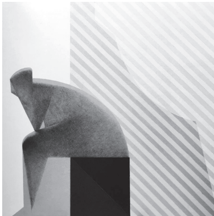
Іл. 4. В. Буденкевич. Академічне завдання. Полотно, акрил, графіт. 100×100 см. 2009 (Максименко, Рисунок )